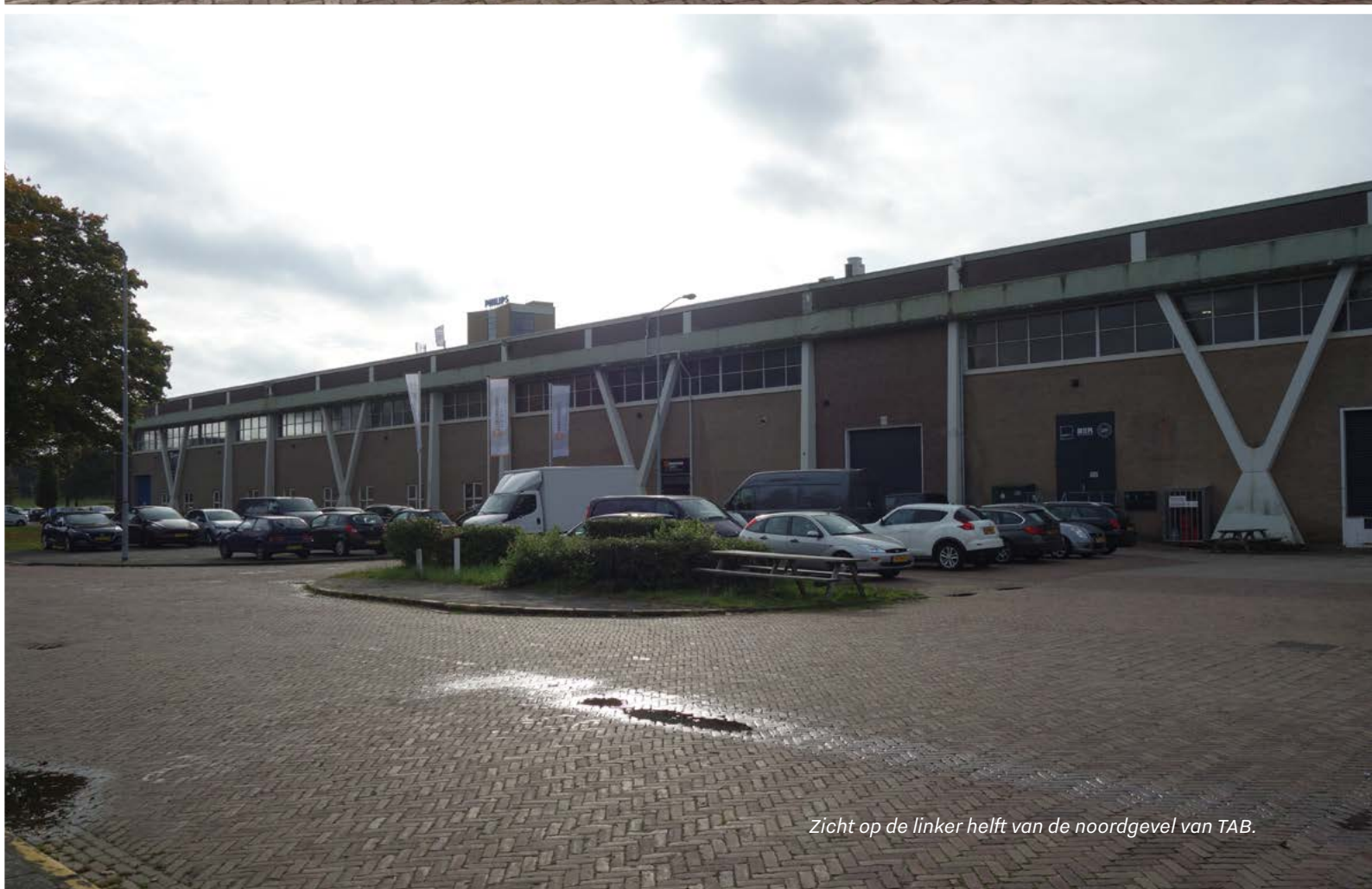
Zicht op de linker helft van de noordgevel van TAB.