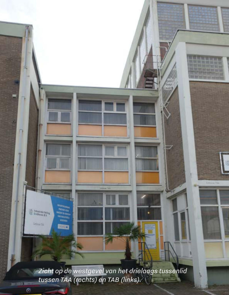
Zicht op de westgevel van het drielaags tussenlid tussen TAA (rechts) en TAB (links).