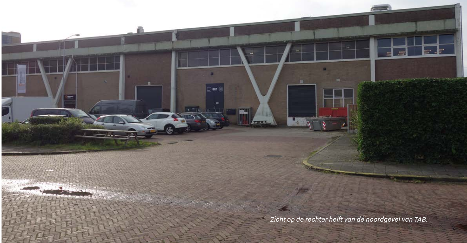
Zicht op de rechter helft van de noordgevel van TAB.