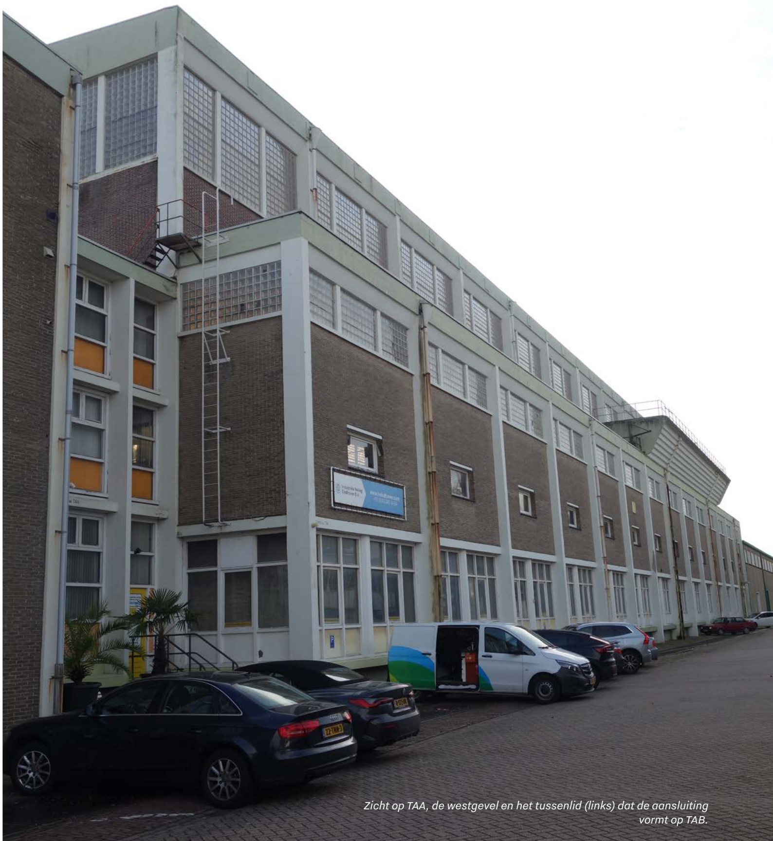
Zicht op TAA, de westgevel en het tussenlid (links) dat de aansluiting vormt op TAB.