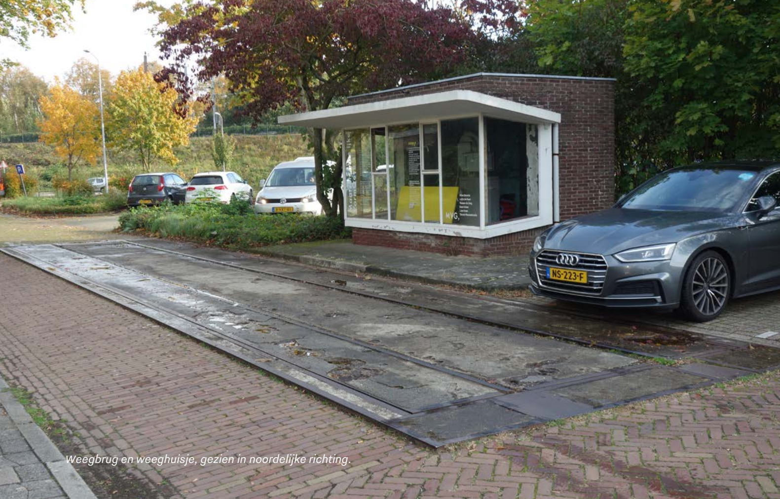
Weegbrug en weeghuisje, gezien in noordelijke richting.