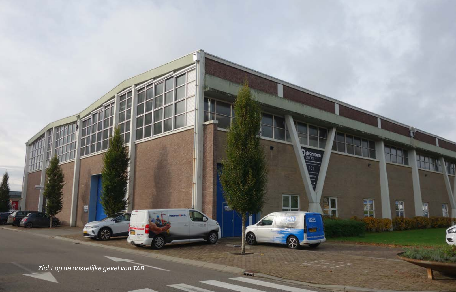
Zicht op de oostelijke gevel van TAB.