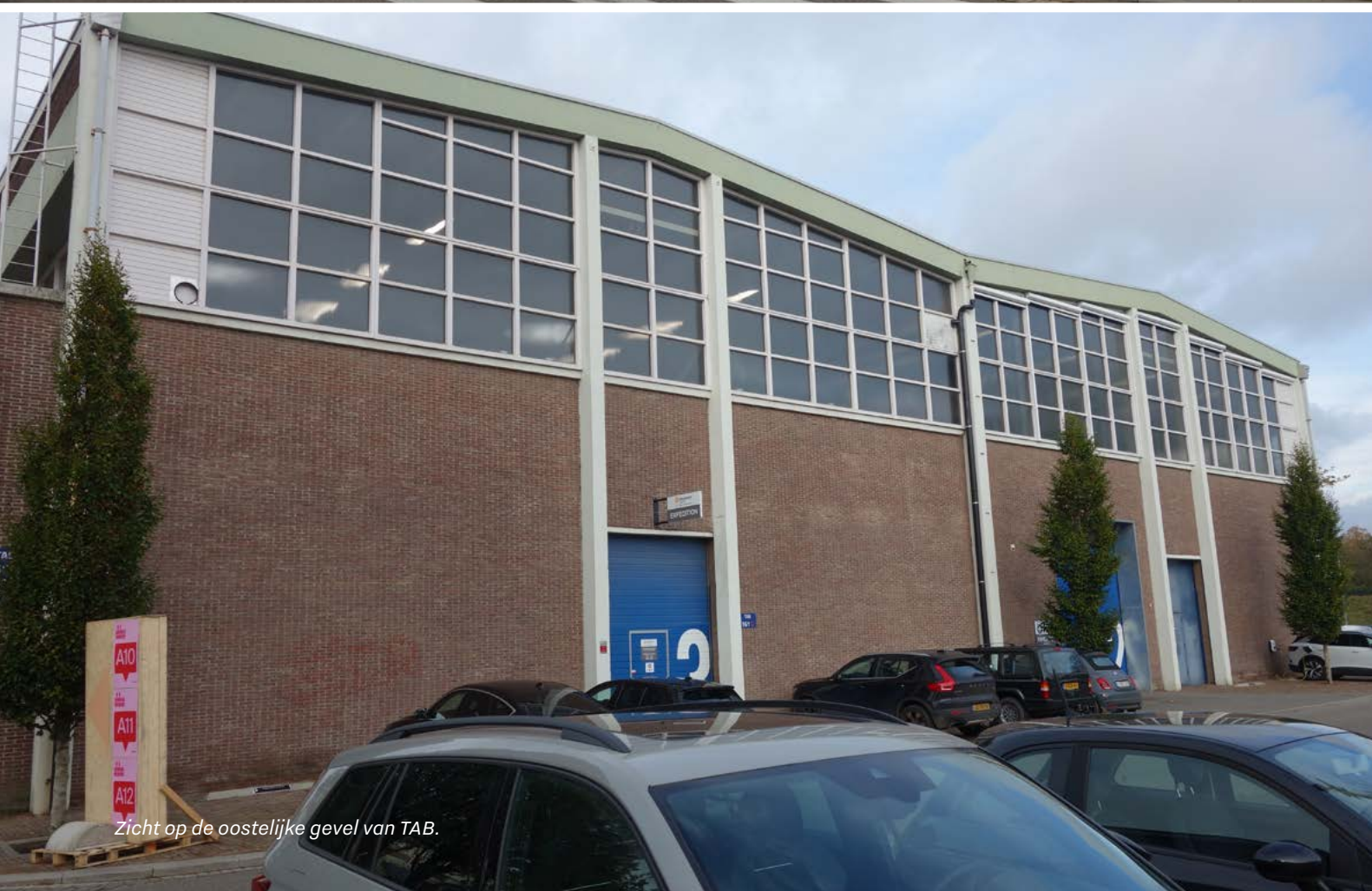
Zicht op de oostelijke gevel van TAB.