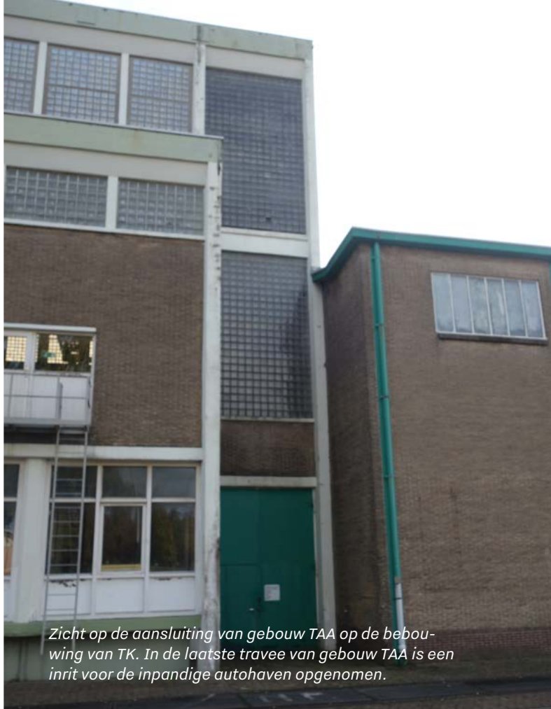
Zicht op de aansluiting van gebouw TAA op de bebouwing van TK. In de laatste travee van gebouw TAA is een inrit voor de inpandige autohaven opgenomen.