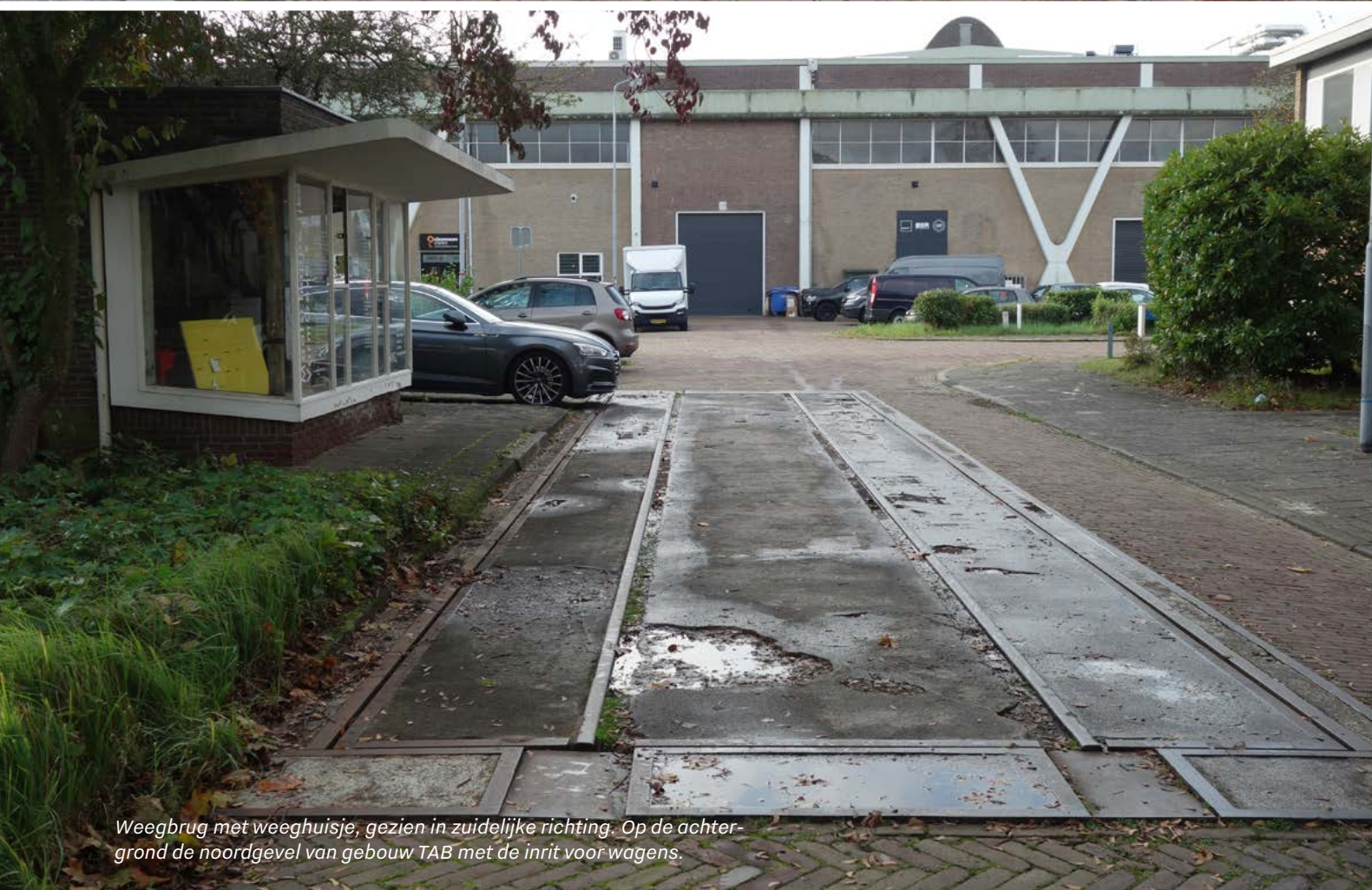
Weegbrug met weeghuisje, gezien in zuidelijke richting. Op de achtergrond de noordgevel van gebouw TAB met de inrit voor wagens.