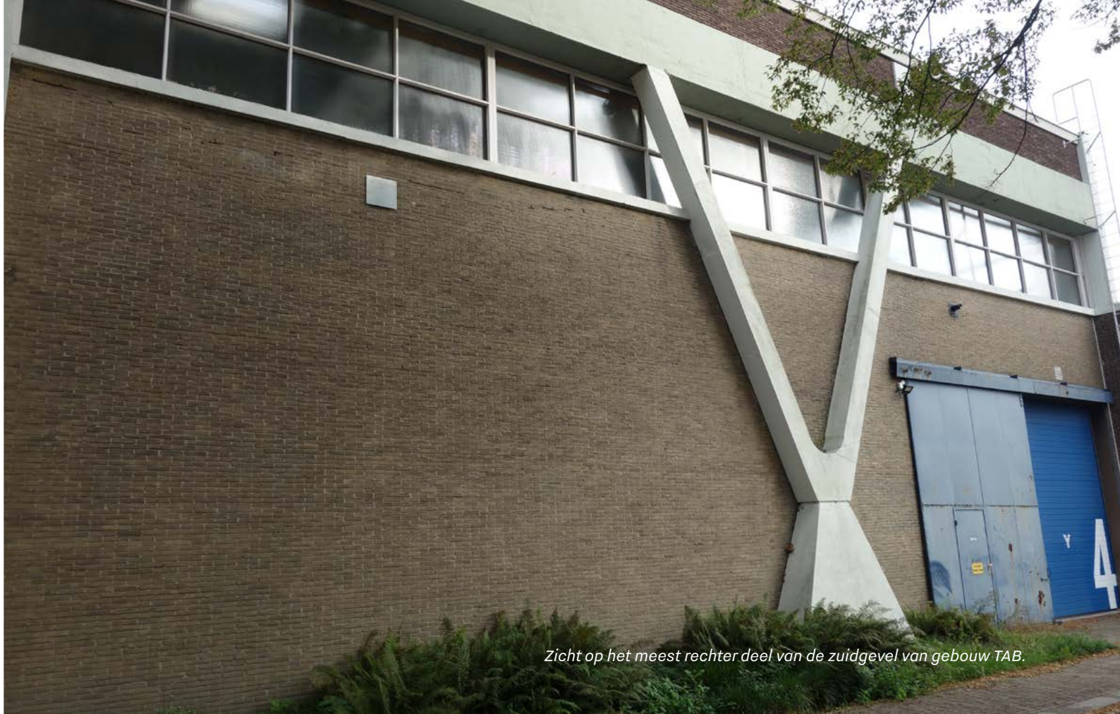
Zicht op het meest rechter deel van de zuidgevel van gebouw TAB.