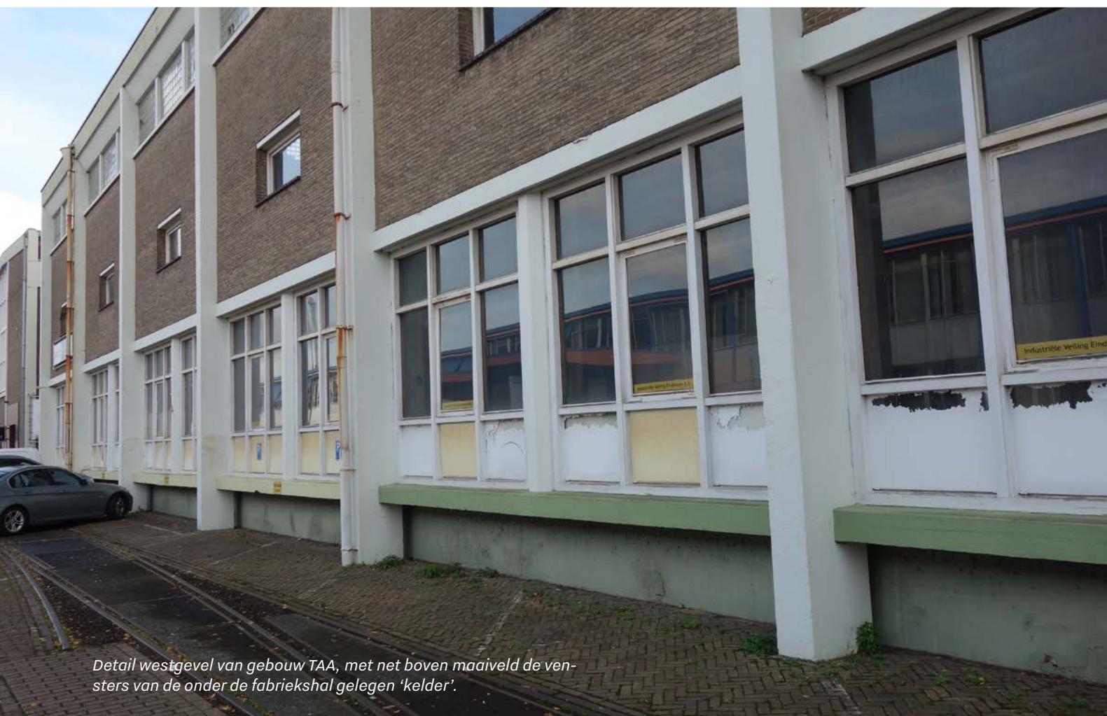
Detail westgevel van gebouw TAA, met net boven maaiveld de vensters van de onder de fabriekshal gelegen 'kelder'.