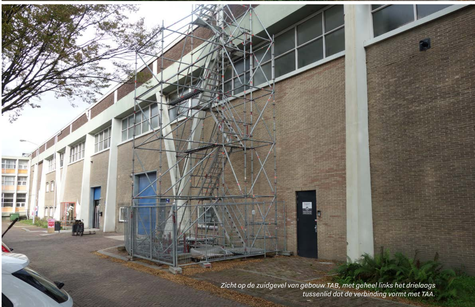
Zicht op de zuidgevel van gebouw TAB, met geheel links het drielaags tussenlid dat de verbinding vormt met TAA.