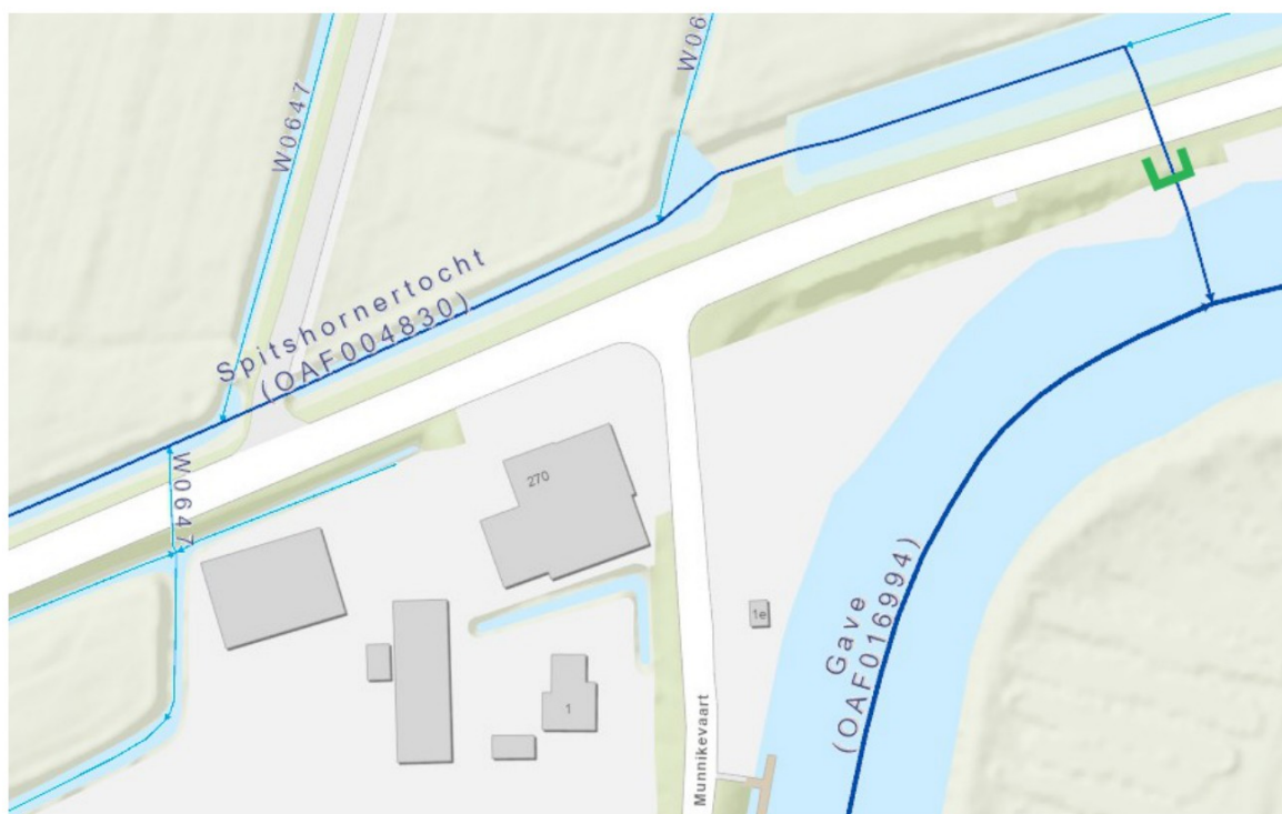
Figuur 1: De groene lijn geeft globaal de locatie weer van de te vervangen damwand.

Het dagelijks bestuur van het waterschap Noorderzijvest heeft op 4 december 2025 van [REDACTED] een aanvraag ontvangen om een omgevingsvergunning als bedoeld in artikel 5.1, tweede lid, van de Omgevingswet (Ow). De aanvraag betreft het vervangen van de Gave-inlaat nabij Hoofdstraat 270 te Oostwold, zoals hieronder globaal is weergegeven in figuur 1.