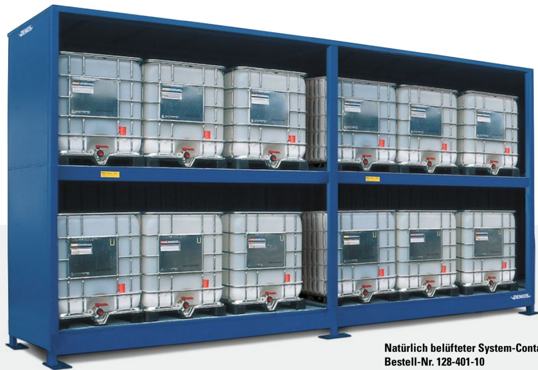
Natürlich belüfteter System-Container 2K 714.0 ohne Tore, Bestell-Nr. 128-401-10