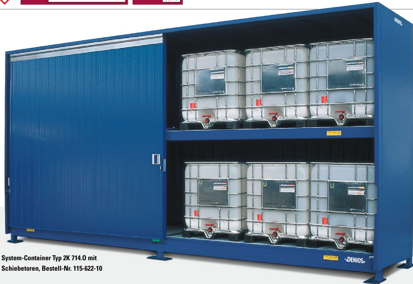
System-Container Typ 2K 714.0 mit Schiebetoren, Bestell-Nr. 115-622-10

Zubehörset bei Lagerung entzündbarer Flüssigkeiten (H224-226)