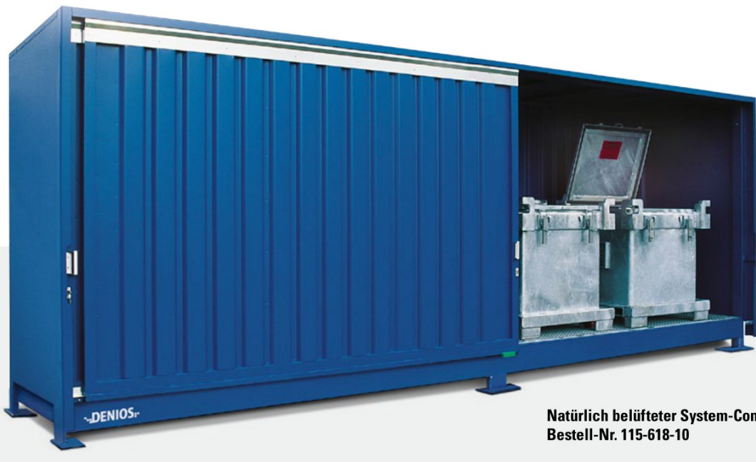
Natürlich belüfteter System-Container 1K 714.0 mit Schiebetoren, Bestell-Nr. 115-618-10

i Alle System-Container in offener Version oder mit Flügel- / Schiebetoren eignen sich durch den Einsatz unseres Erdungs-Sets hervorragend für die Lagerung entzündbarer Flüssigkeiten (H224-226).