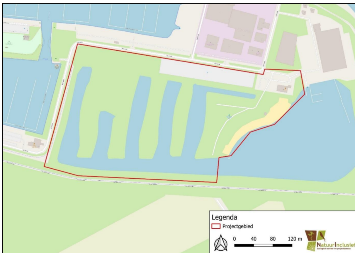
Figuur 1. Locatie Marinaweg te Drimmelen. De activiteiten vinden plaats binnen het omlijnde gebied.