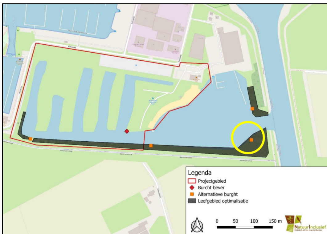
Figuur 3. Locatie van de permanente voorzieningen. Alternatieve burchtlocaties met oranje weergegeven. Locatie van de bevervlot geel omcirkeld. De aangetroffen beverburcht in rood.