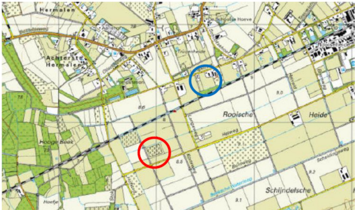
Figuur 1 – locatie populierenweide SDL 00 M 249 (rood) en herplantperceel SDL M 270 (blauw)