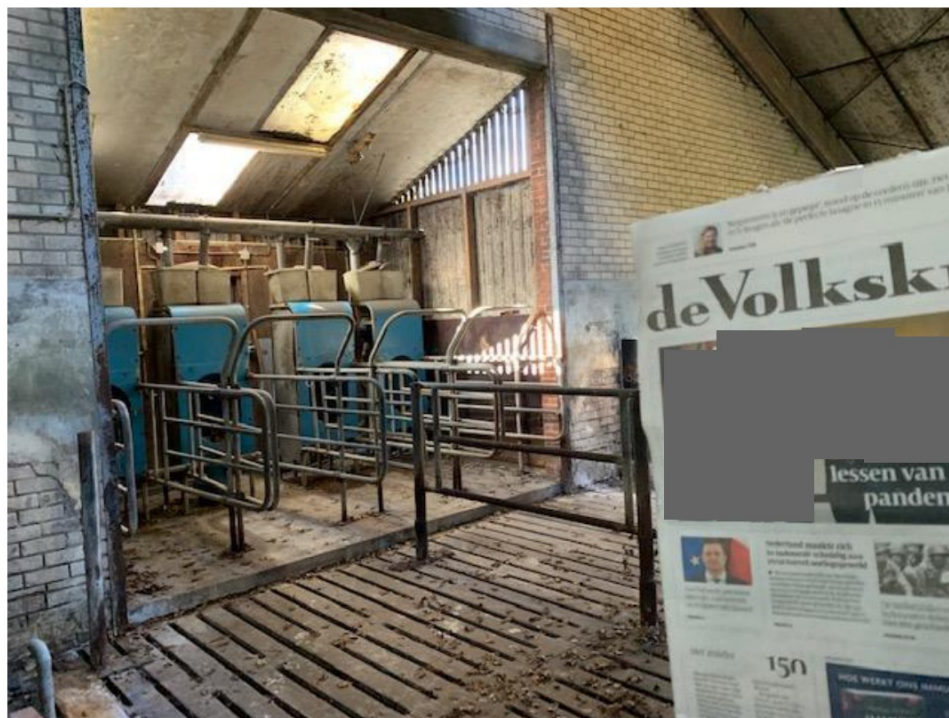
Europaweg 188 – Stal 3 (stal A op de milieutekening)