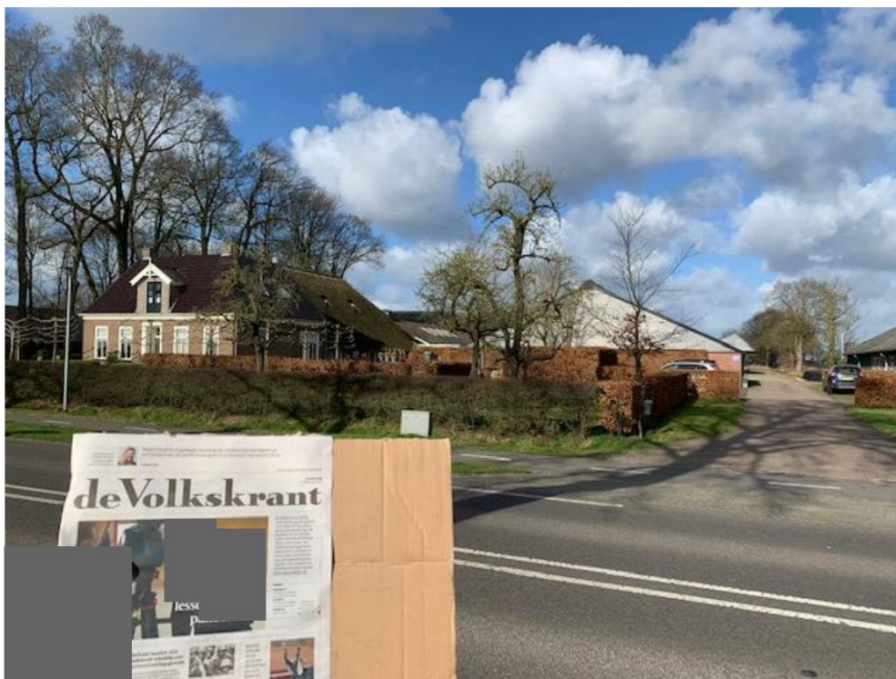
Europaweg 188 – Stal 1 (stal B op de milieutekening)