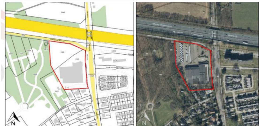
Figuur 1: Projectlocatie Edeseweg 147 te Bennekom (PDOK)