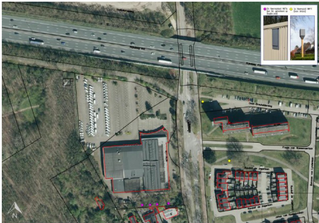
Figuur 3: Locaties van de tijdelijke kasten aan palen (paars) en vleermuistillen (geel)