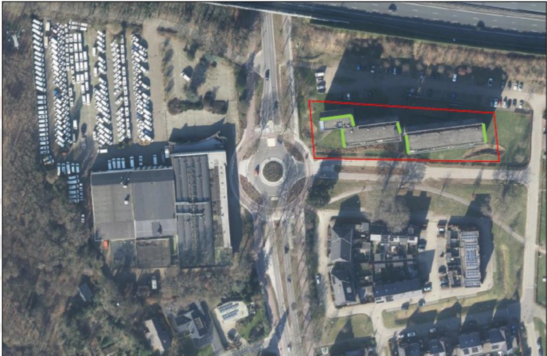
Figuur 4: Beoogde locaties voor de 3 tijdelijke vleermuiskasten (VMTH1a, groen)