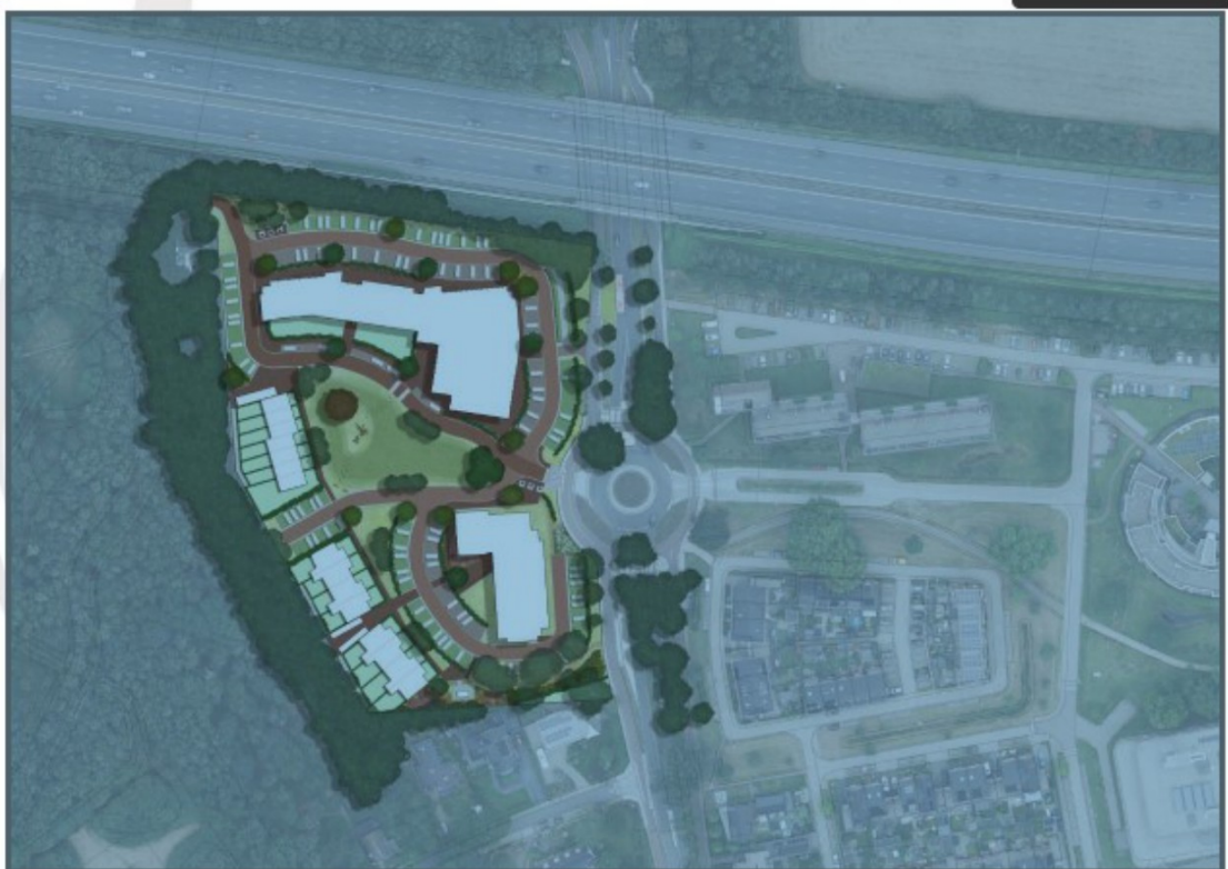
Figuur 2: Beoogde inrichting projectlocatie (Zenzo Bennekom B.V.)