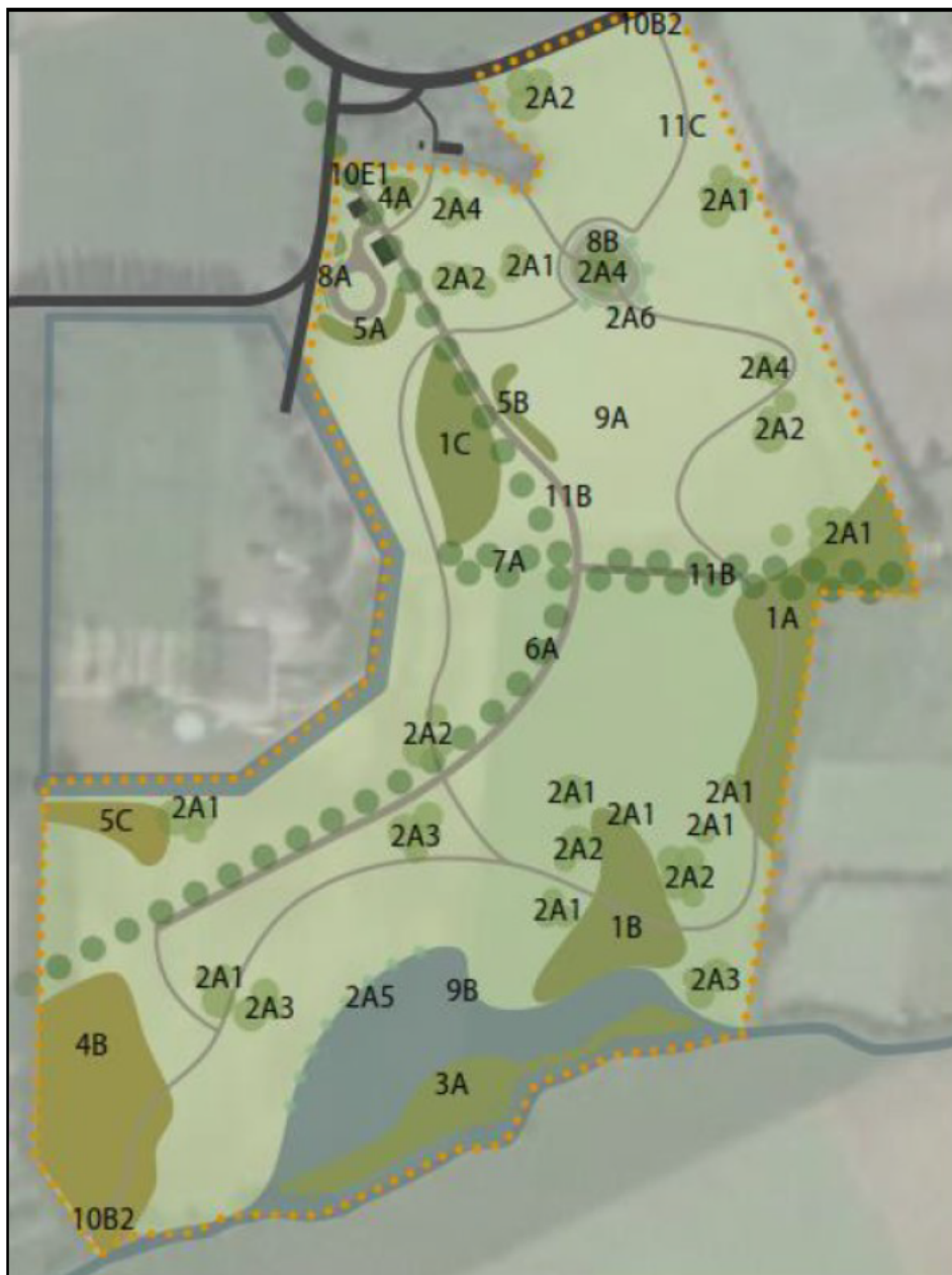
Figuur 3: Het inrichtingsplan van de natuurbegraafplaats. Aanduidingen: 1: Vogelbosje (dennen-, eiken- en beukenbos, 2: Solitaires, clumps en knotbomen, 3: Vochtige bosjes, 4: Struweel, 5: Singel/houtwal, 6: Bomenrij, 7: Laan, 8: Landschapshaag, 9: Kruidenmengsel, 10: Slagbomen, 11: Verharding.