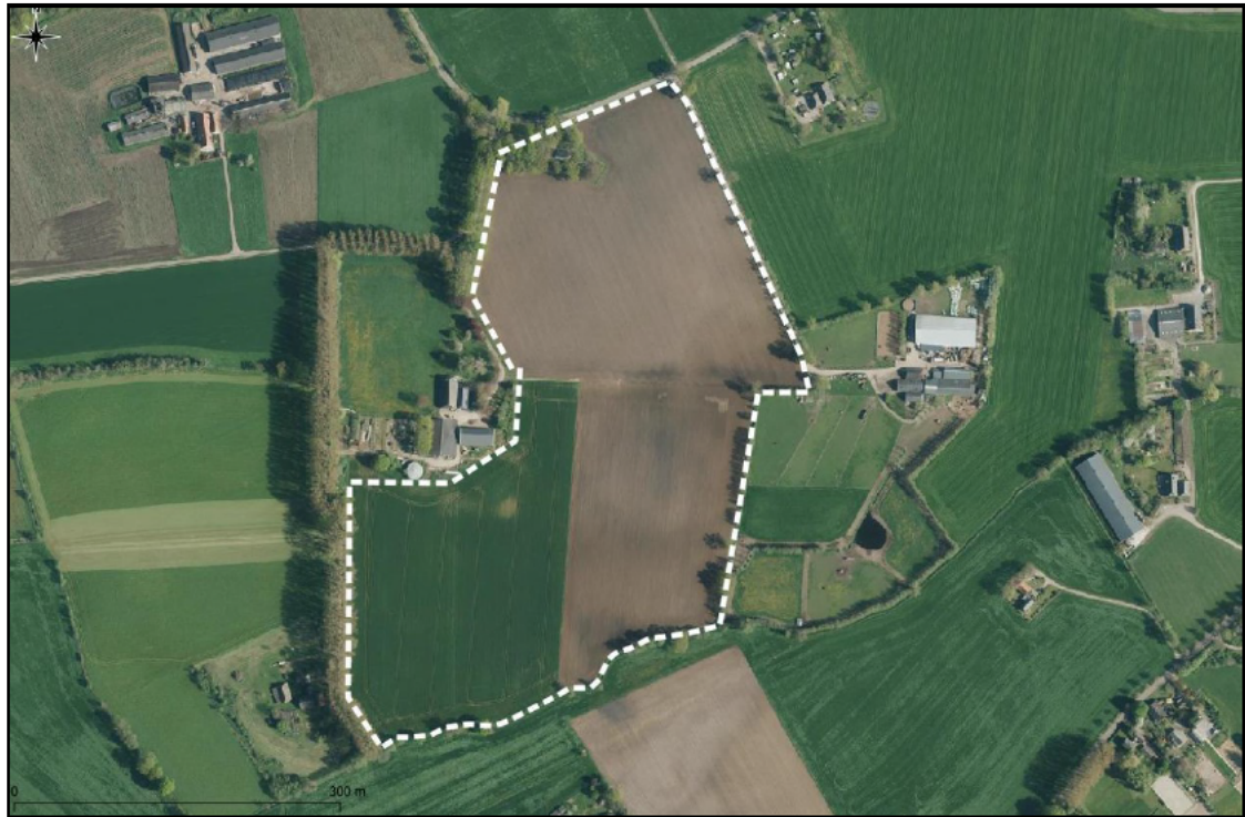
Figuur 2: Ligging van de planlocatie aan de Kapelweg te Sinderen, perceel Varsseveld C2608.