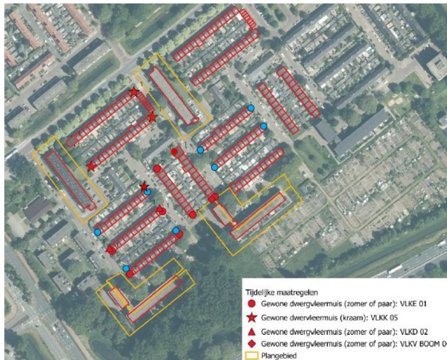
Figuur 2. Locaties van de tijdelijke voorzieningen (rood) voor gewone dwergvleermuis inclusief de extra tijdelijke kasten voor de worst-case benadering (blauwe rondjes = type VLKE 01).