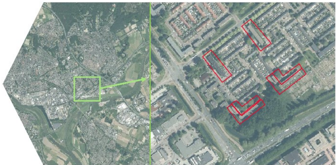
Figuur 1: Ligging van het plangebied: links de ligging binnen de regio (groen omkaderd) en rechts de ligging van het plangebied (rood). Bron luchtfoto: PDOK.

Figuur 1. Ligging van het plangebied (rood) in de omgeving (groen). Bron luchtfoto: PDOK.