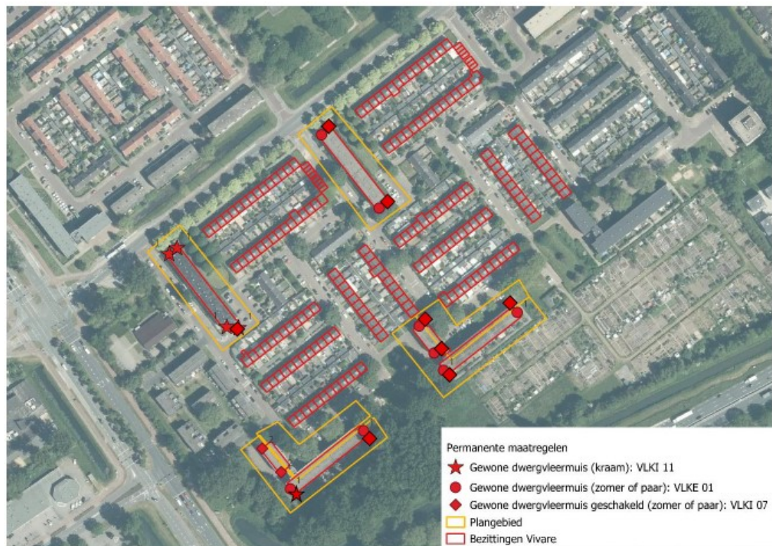
Figuur 3. Locaties van de permanente voorzieningen voor gewone dwergvleermuis (rood).