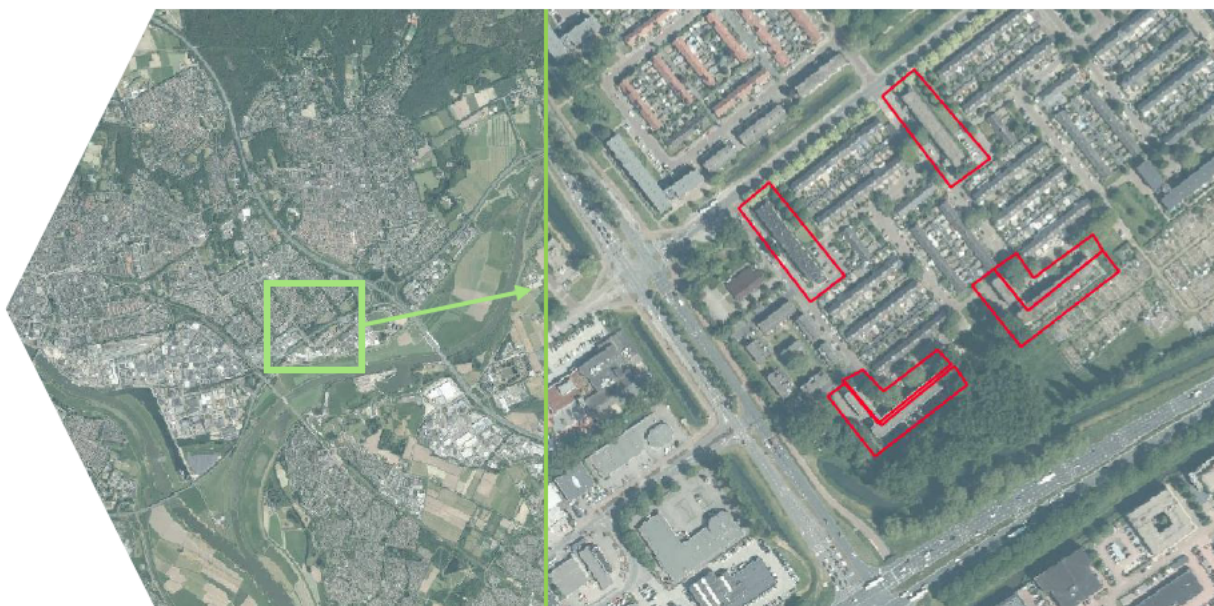
Figuur 1: Ligging van het plangebied: links de ligging binnen de regio (groen omkaderd) en rechts de ligging van het plangebied (rood).