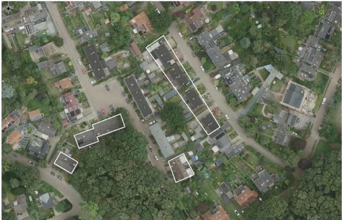
Figuur 1: Overzichtskaart met de woningen waaraan onderhoud wordt uitgevoerd (wit omlijnd).