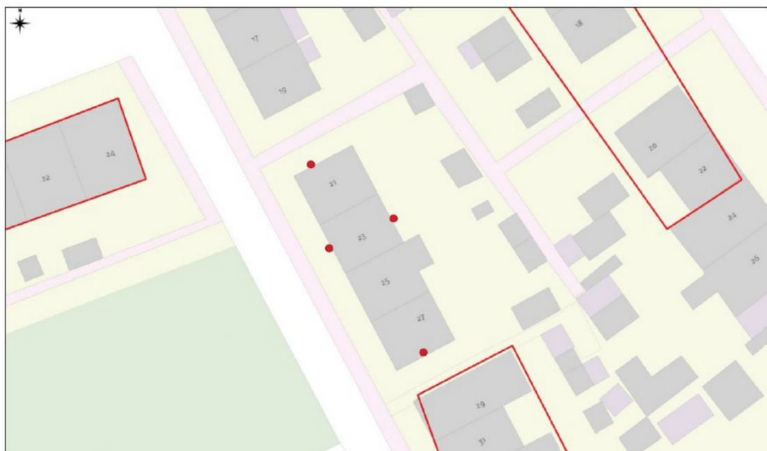
Figuur 2: Locaties van de vier tijdelijke vleermuiskasten voor gewone dwergvleermuis (VK MP o8). De kast aan de oostzijde van Simonlaan 23 is verplaatst naar de westgevel van nummer 25, omdat aan de oostzijde geen geschikte locatie gevonden kon worden.