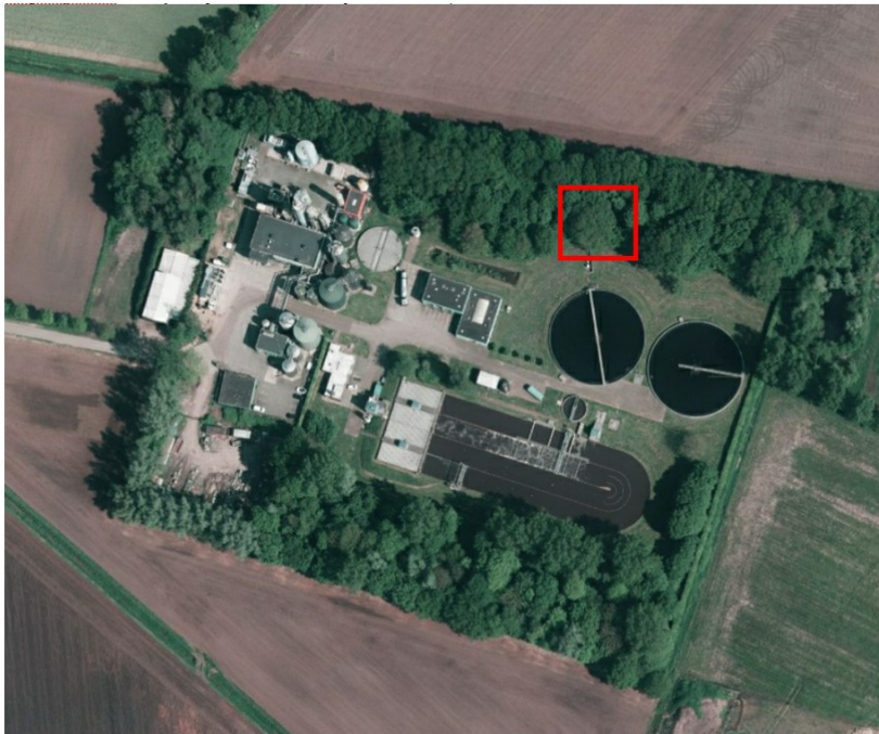
Figuur 3: Luchtfoto 2024 van de herplantlocatie op perceel LTVoo, sectie N, nummer 1355. De herplant van 3 bomen is met groene cirkels aangegeven.