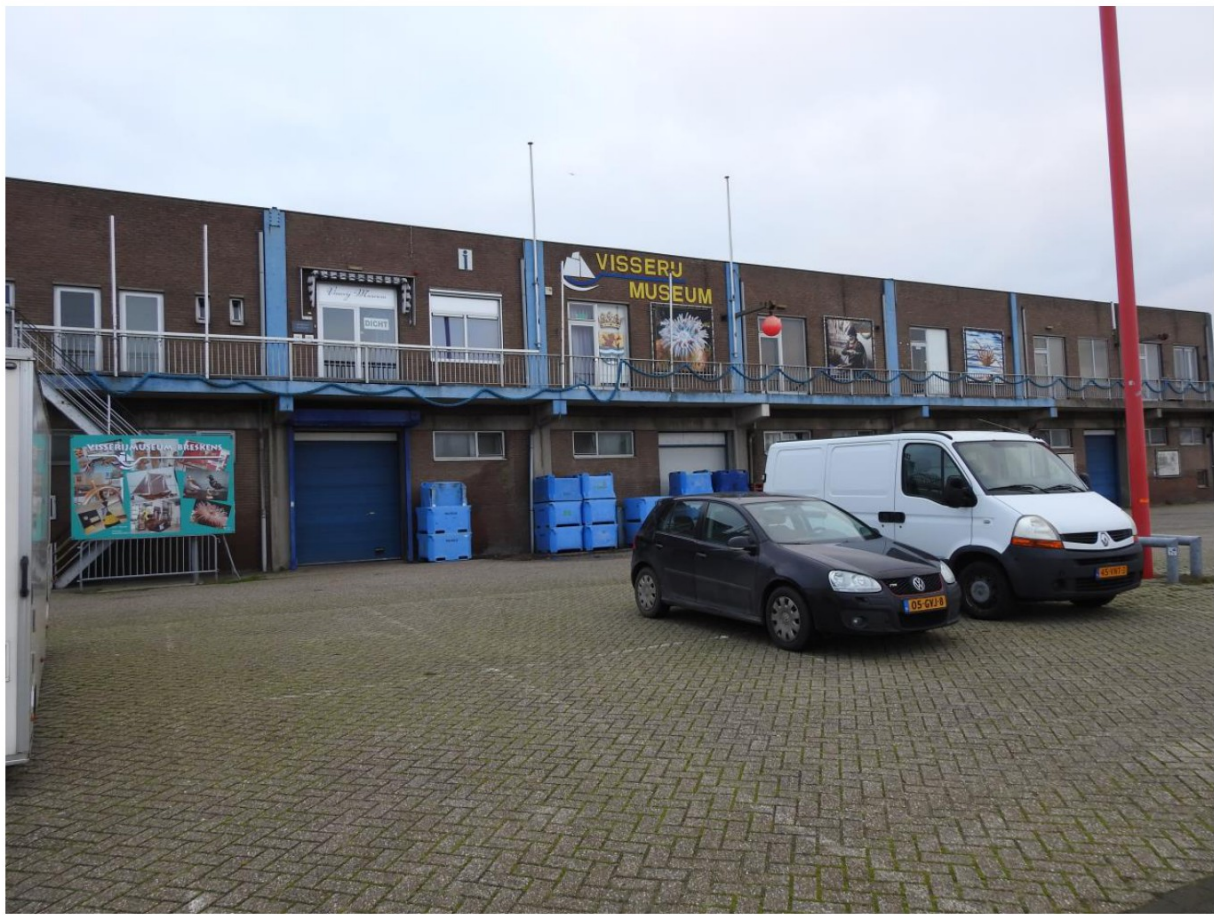
Foto 1. Te slopen bebouwing.

De bebouwing zal gesloopt worden door middel van ontmanteling. Rondom de bebouwing is een verharding en water. Er is veel menselijke activiteit.