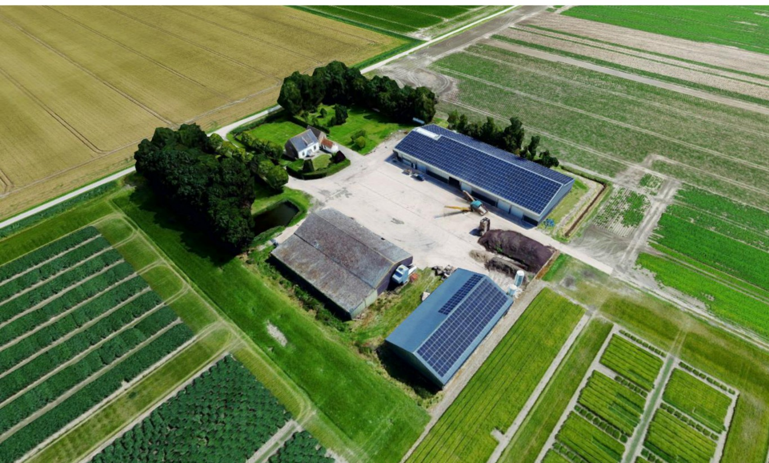
Vogelvlucht foto van het bestaande terrein vanuit zuid- westelijke richting.