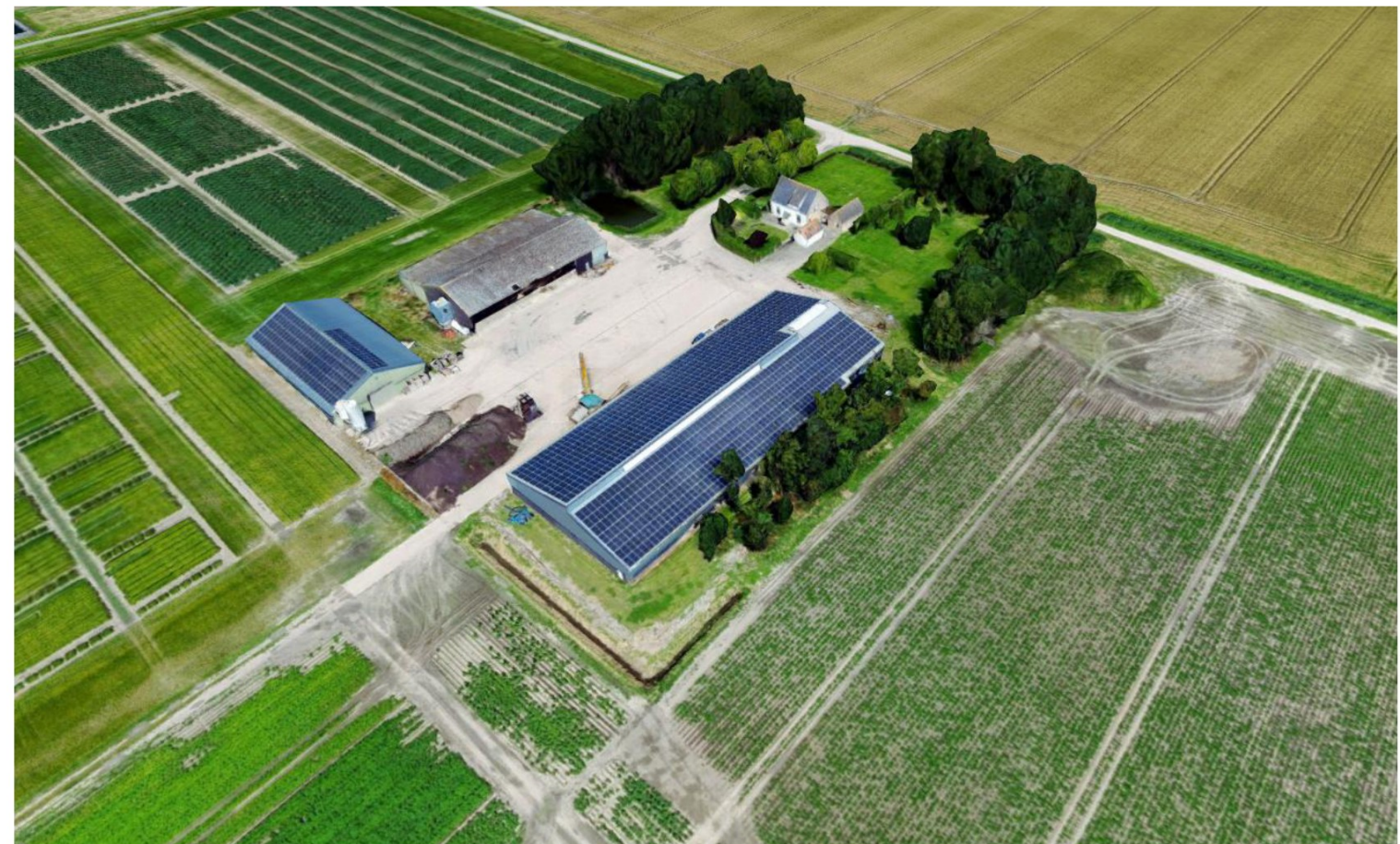
Vogelvlucht foto van het bestaande terrein vanuit zuid- oostelijke richting.