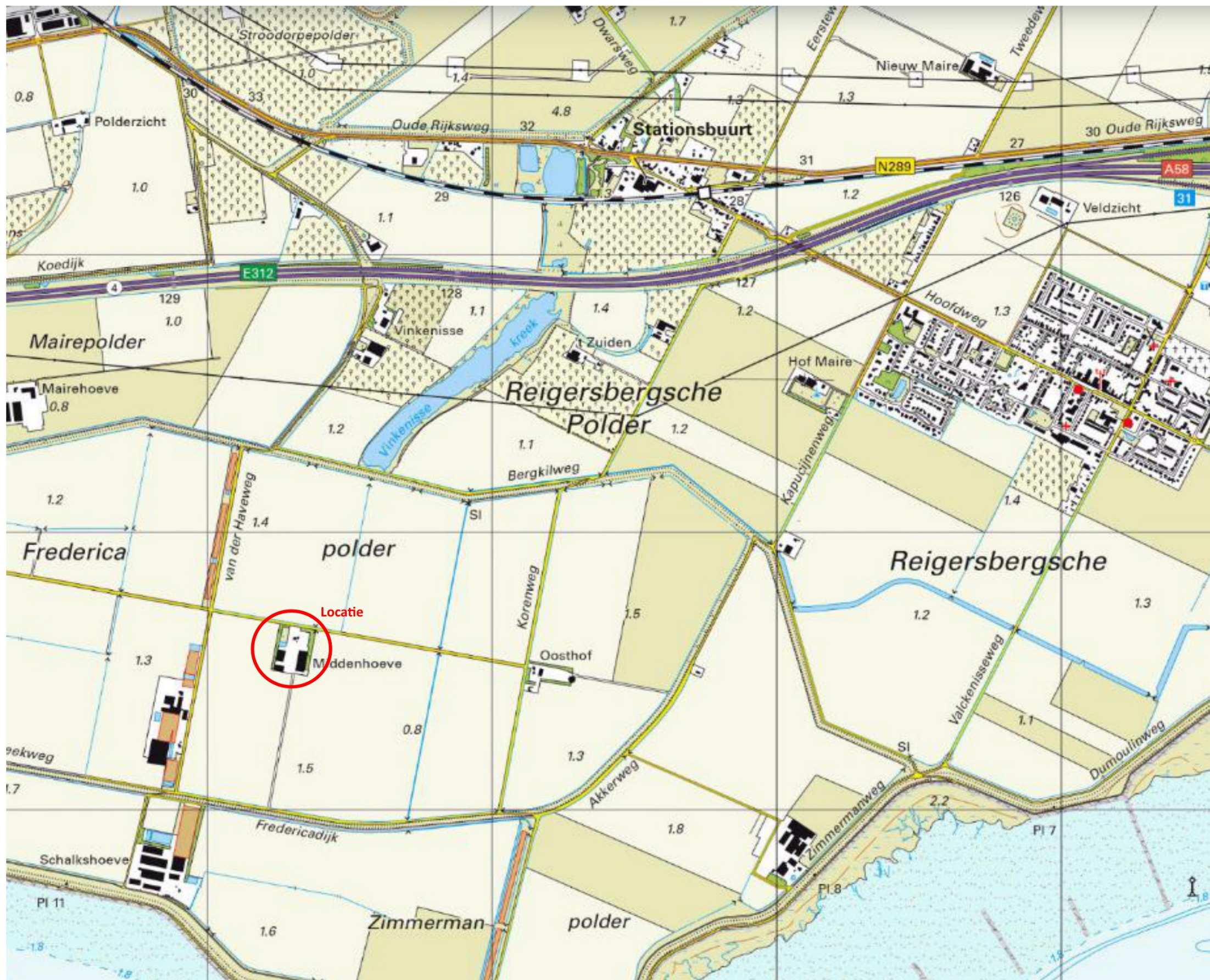
Topografische kaart 2022 met aanduiding locatie (topografische kaart: topotijdreis.nl)