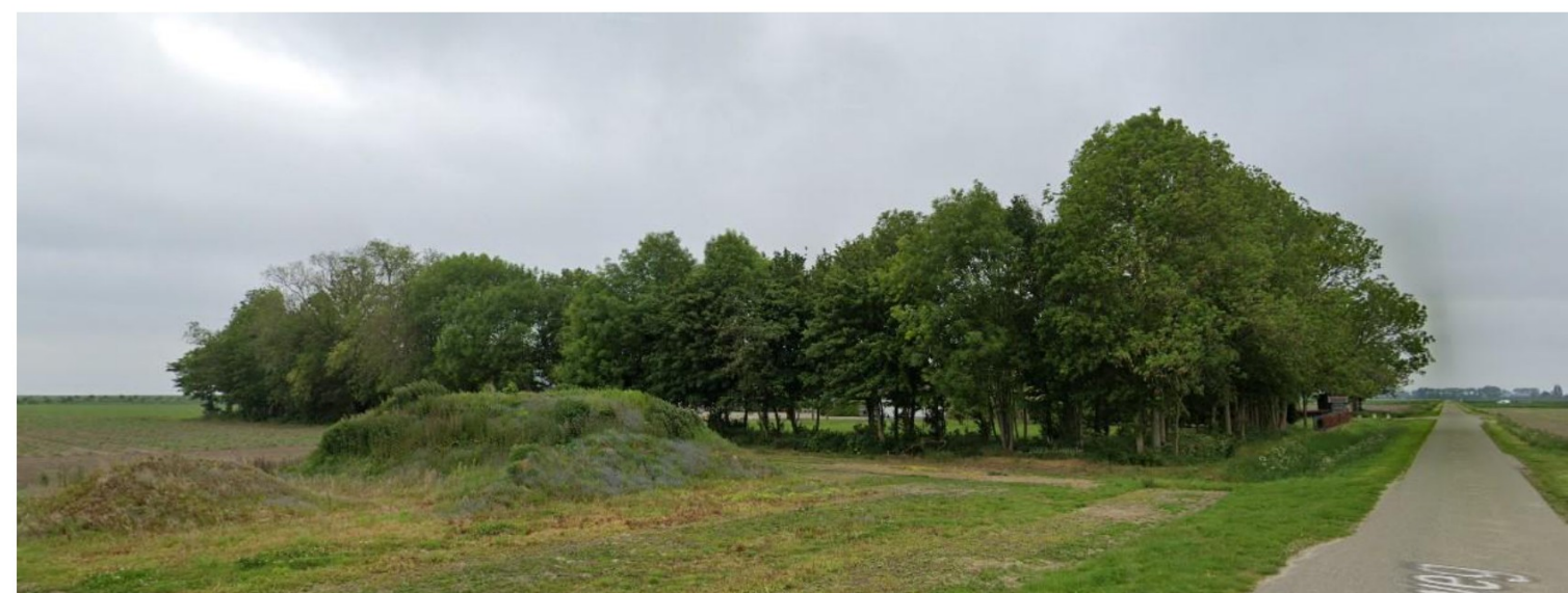
Zicht vanaf de Frederikaweg in zuid- westelijke richting op de bestaande bomenrij en achterliggende bebouwing.