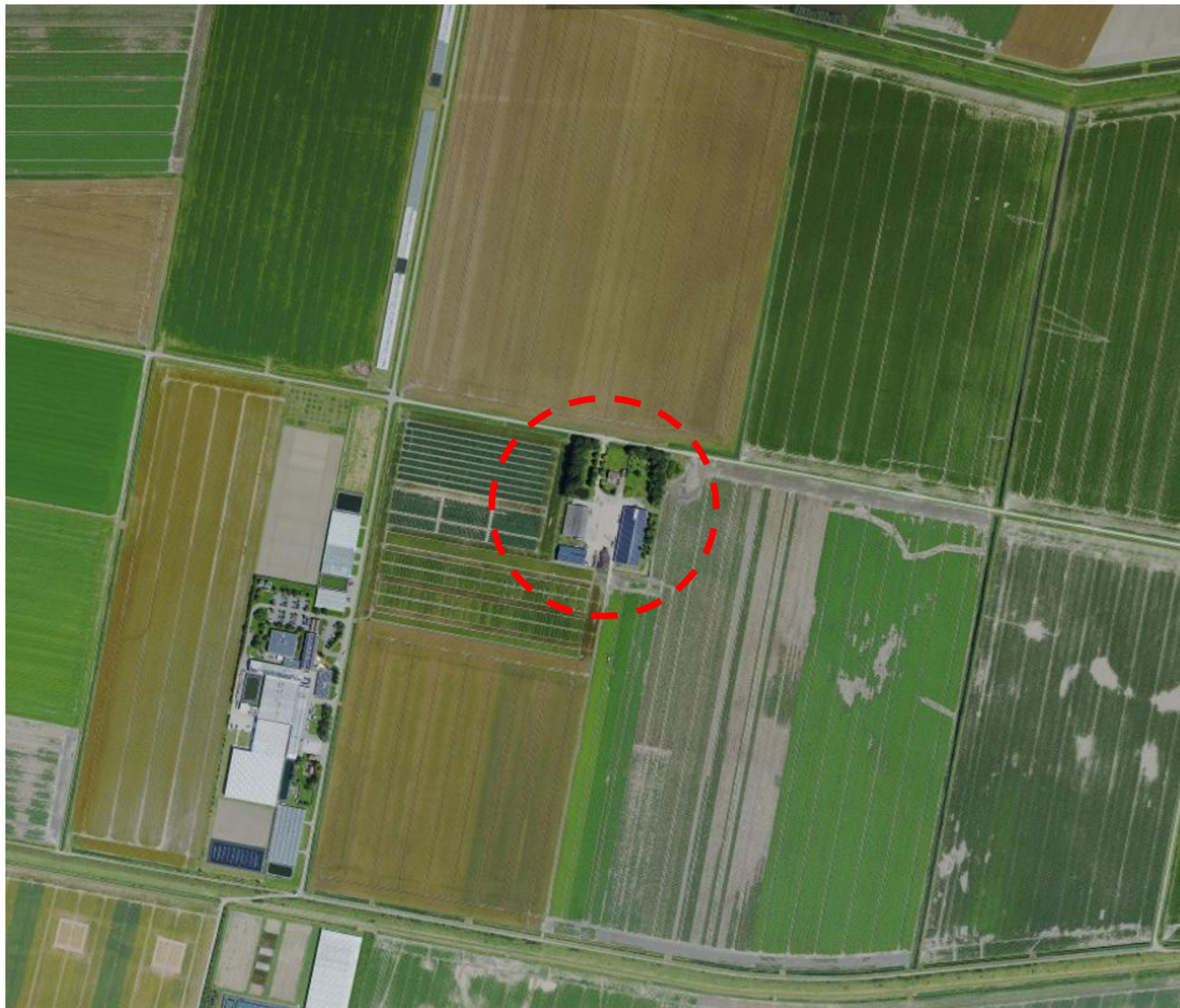
Luchtfoto 2024 met aanduiding locatie