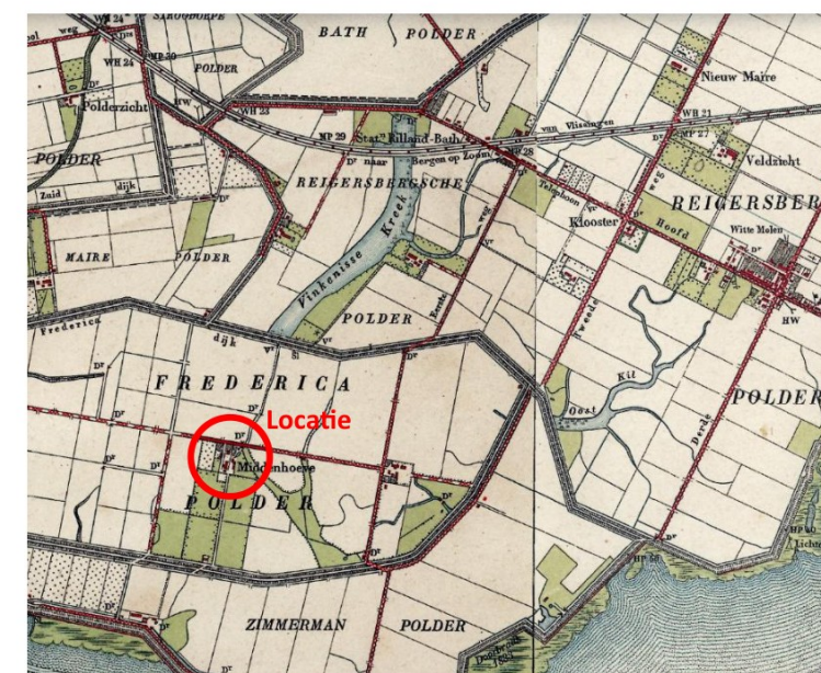
Historische kaart 1910 (kaart: topotijdreis.nl)

Er is de wens om een nieuwe bewaring / machine- en werktuigberging te realiseren.