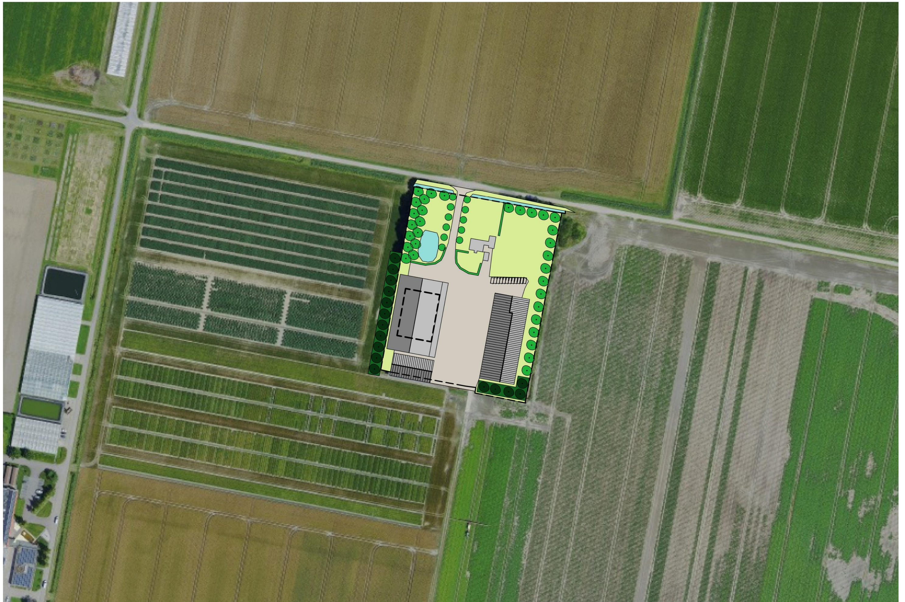
Projectie landschappelijke inpassingsplan in luchtfoto