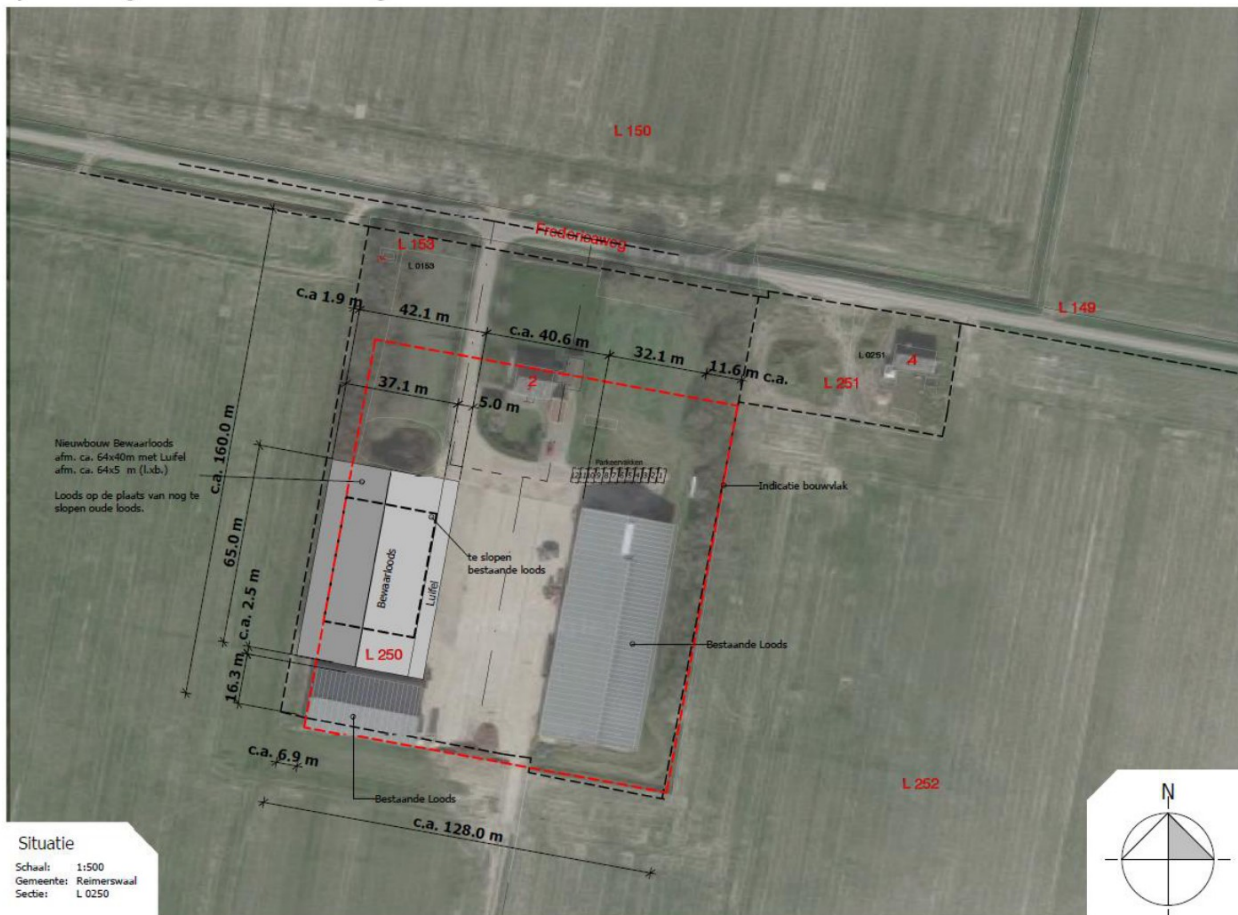
Afbeelding 2: Situatietekening

Op het perceel zit een agrarisch bestemming conform vigerende bestemmingsplan Buitengebied 2022.