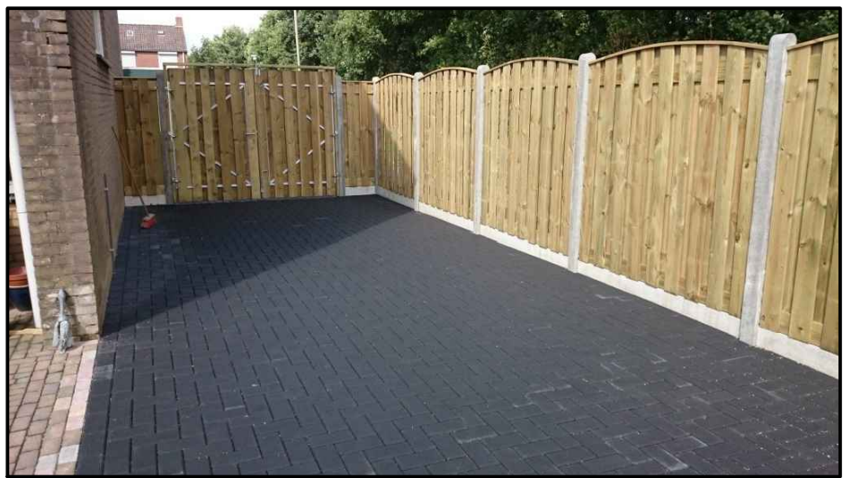
voorbeeld bestrating betonlinkers

bovenstaande voorbeelden dienen puur ter indicatie exacte toe te passen materialen en uitvoering n.t.b.