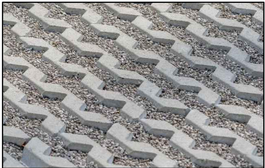
voorbeeld grasbetontegels v.z.v. grind t.p.v. parkeerplaatsen waterdoorlatend naar drainstabil infiltratiezone