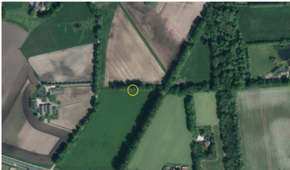
Figuur 3: Locatie van de 2 e alternatieve dassenburcht in de vorm van een grondhoop.