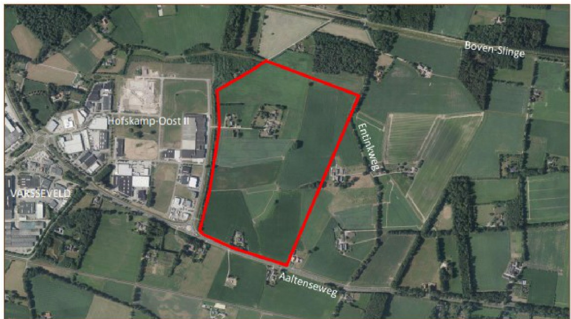
Figuur 1: Overzicht van het plangebied.