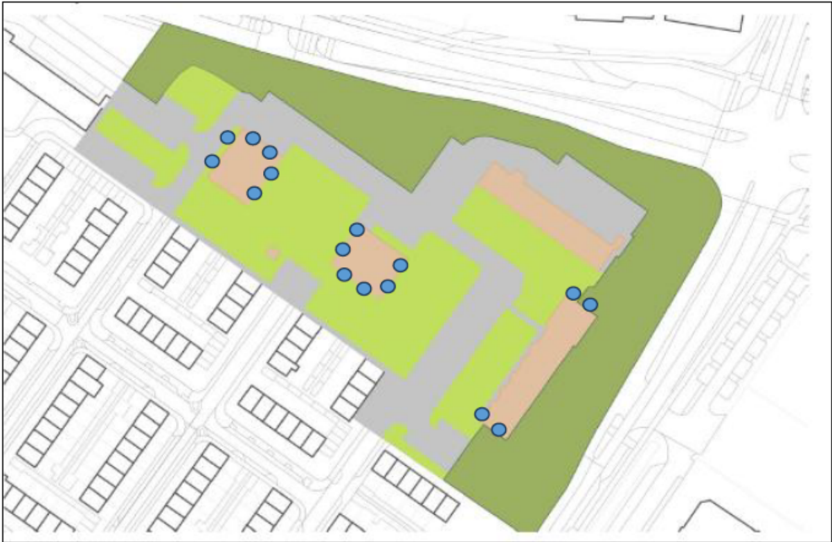
Figuur 8. Locaties van de permanente voorzieningen (VMPM1s) in deelgebied 1: Ranonkelstraat. De locaties van de inbouwvoorzieningen zijn aangegeven met blauwe bolletjes, waarbij elk bolletje staat voor 1 voorziening (16).