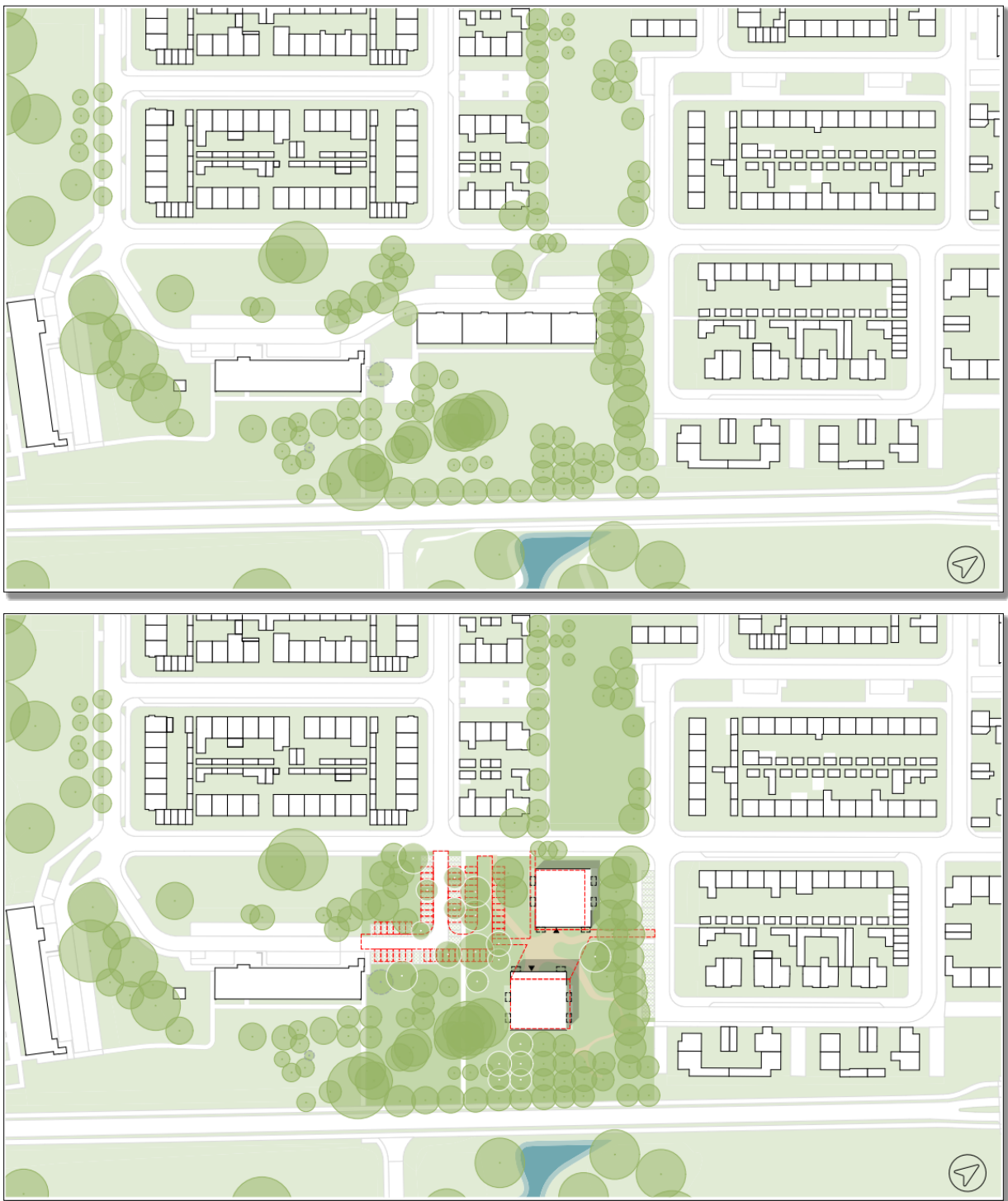
Figuur 5. Deelgebied 2: Boerhaavelaan 31-77. De bovenste afbeelding geeft de huidige situatie weer. Het meest oostelijke appartementencomplex wordt gesloopt. De onderste afbeelding geeft de nieuwe situatie met de nieuwbouw (op de locatie van het te slopen appartementencomplex) weer. Het betreft een oudere portiekflat met 24 woningen. In de nieuwe situatie komen 60 woningen terug, verdeeld over 2 woonblokken.

weer. Het meest westelijke blok wordt 5 bouwlagen (15 meter), het middelste blok 4 bouwlagen (12 meter) en in zuidoost staat een galerijflat van 5 bouwlagen (15 meter).