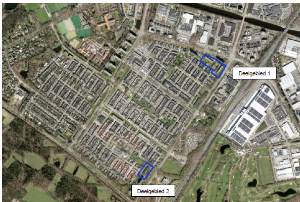
Figuur 1. Locatie van de 2 deelgebieden in de wijk Oosterheide te Oosterhout. De activiteiten vinden plaats binnen de blauw omlijnde gebieden.