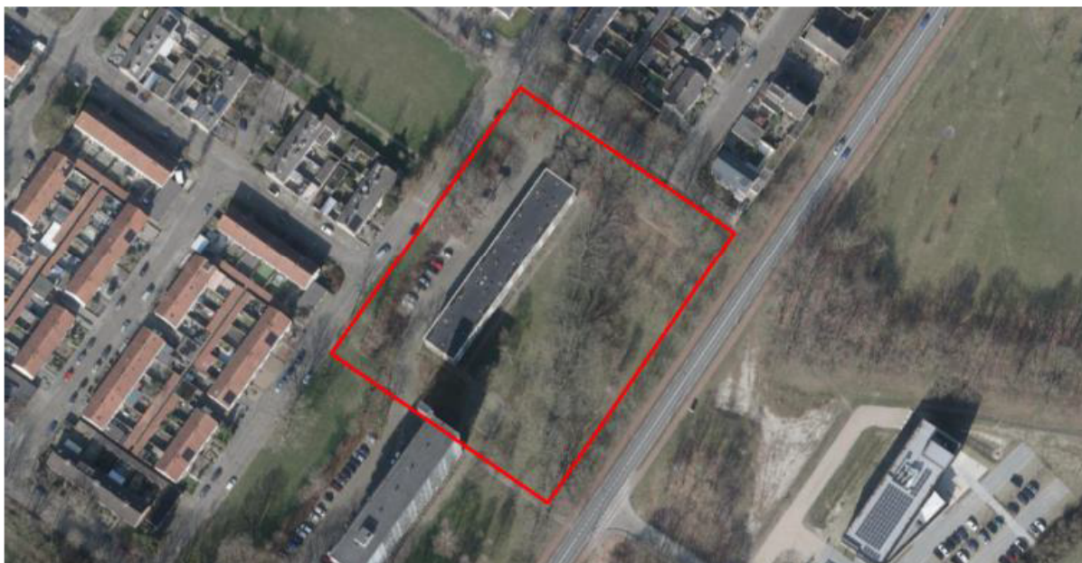
Figuur 3. Deelgebied 2: Boerhaavelaan 31 tot en met 77. De activiteiten vinden plaats binnen de rood omlijnde gebieden.