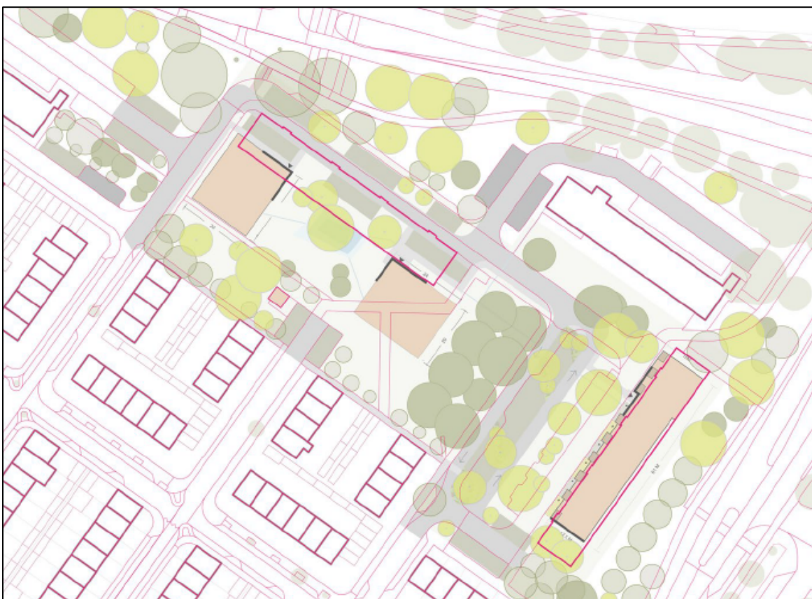
Figuur 4. Deelgebied 1: Anemoonstraat 2-48 en Ranonkelstraat 1-47. De huidige situatie is weergegeven met rode omlijning. De 2 meest zuidelijk en westelijk gelegen appartementencomplexen worden gesloopt. Deelgebied 1 betreft een tweetal oudere portiekflats uit de jaren '60 met ieder 24 woningen. In totaal zullen dus 48 woningen worden gesloopt. In de nieuwe situatie komen 89 woningen terug, verdeeld over 3 woonblokken. De oranje blokken geven de nieuwe situatie met nieuwbouw