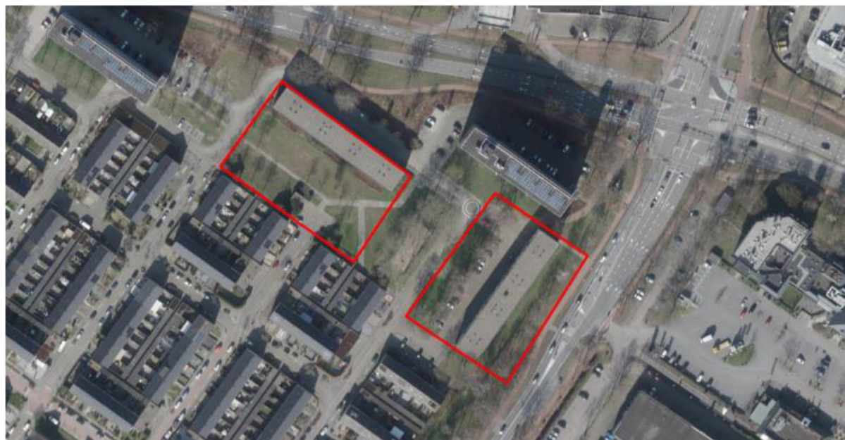
Figuur 2. Deelgebied 1: Anemoonstraat 2-48 en Ranonkelstraat 1-47. De activiteiten vinden plaats binnen de rood omlijnde gebieden.