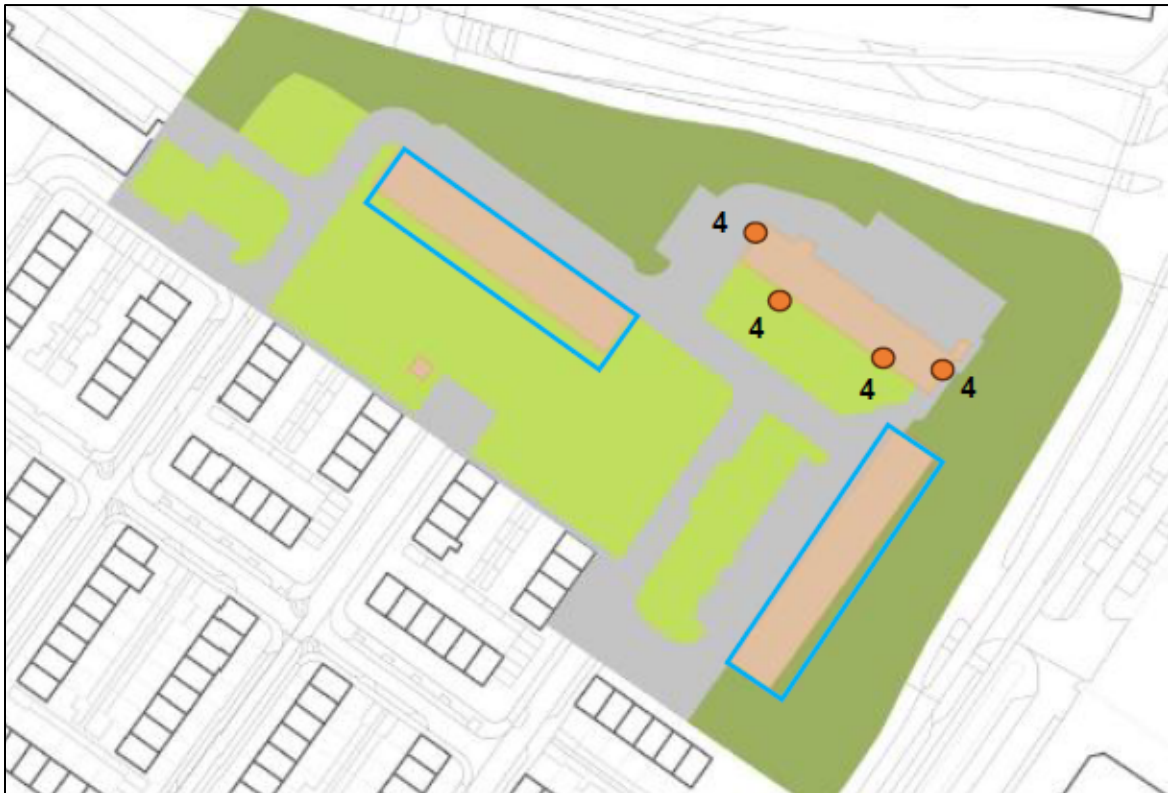
Figuur 6. Locaties van de tijdelijke voorzieningen (VMT1) in deelgebied 1: Anemoonstraat 2-48 en Ranonkelstraat 1-47. De blauwe contour is het plangebied. Locaties en aantal kasten (16) zijn aangegeven met oranje stippen, deze worden verspreid over verschillende gevels van de meest noordelijke flat aan de Rozenstraat bevestigd. Aan de west- en oostgevel worden 2 kasten geplaatst (4). Daarnaast worden aan de zuidgevel 12 kasten verspreid geplaatst.