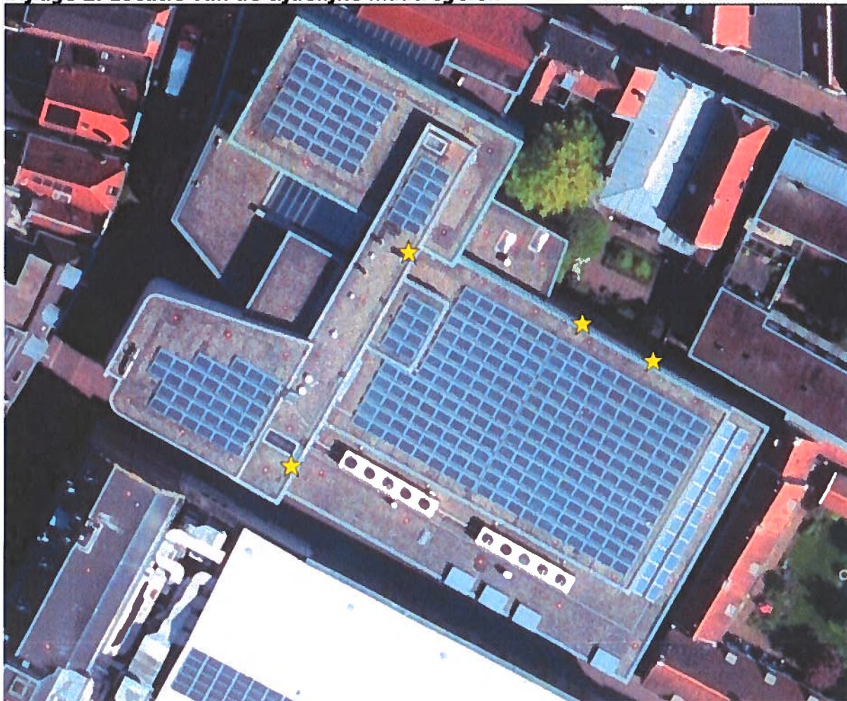
Figuur 2: Weergave van het plangebied en de vier tijdelijke verblijfplaatsen in de omgeving van het plangebied (gele sterren).