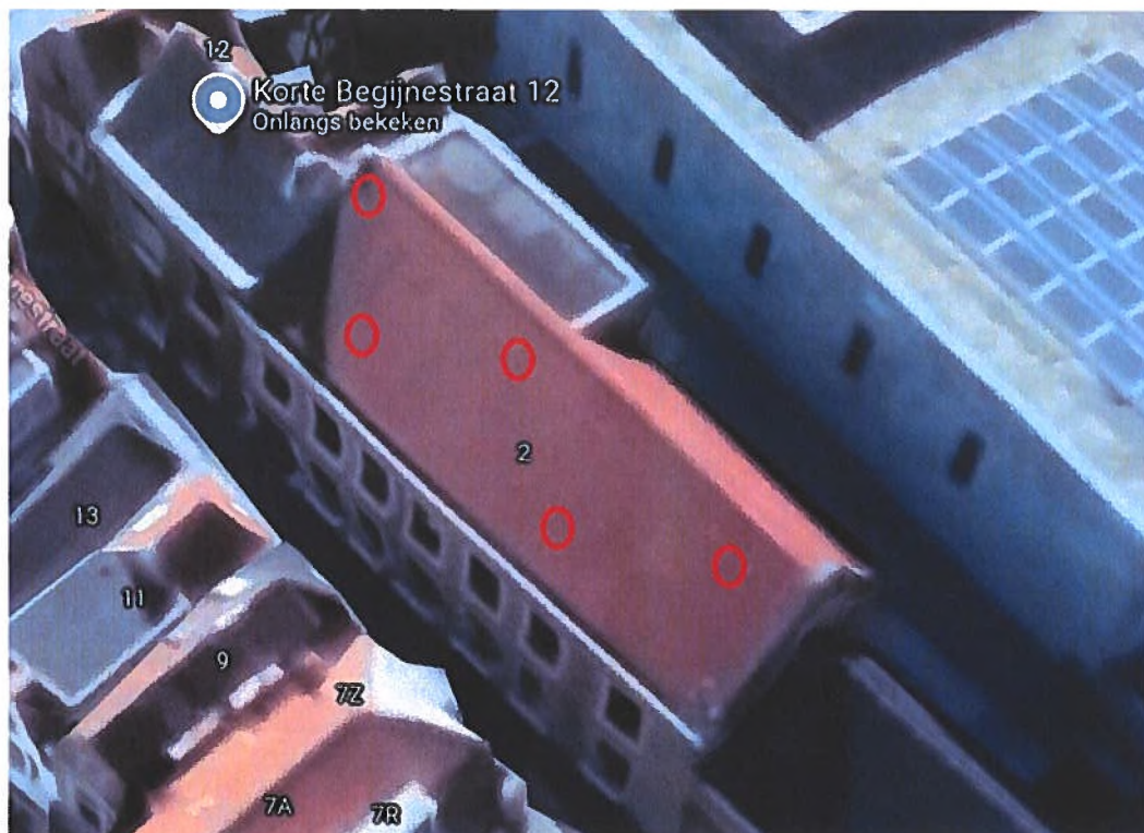
Figuur 3.2: Weergave van de locaties van de vijf permanente verblijfplaatsen in vorm van voorzieningen in het dak (rode cirkels). De locatie hiervan betreft Korte Begijnestraat 2.