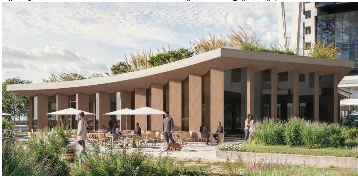
Figuur 4: visualisatie van het paviljoen op het Koningin Julianaplein.