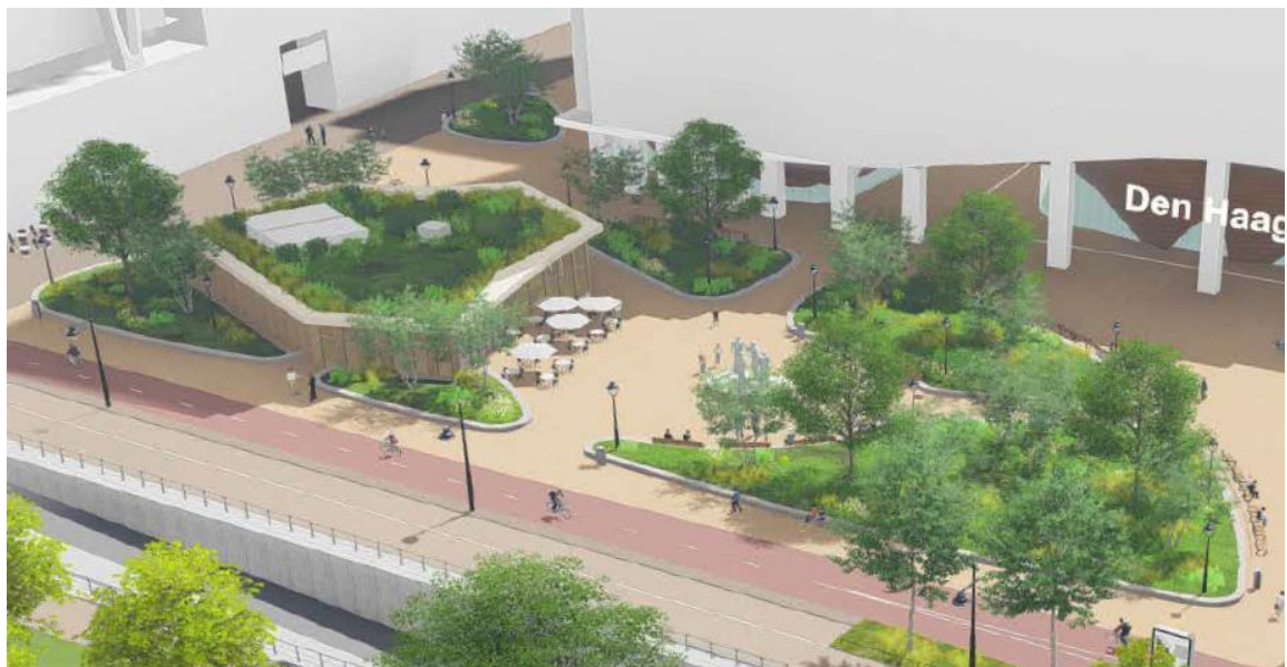
Figuur 2: een groot deel van het plein is vergroend.