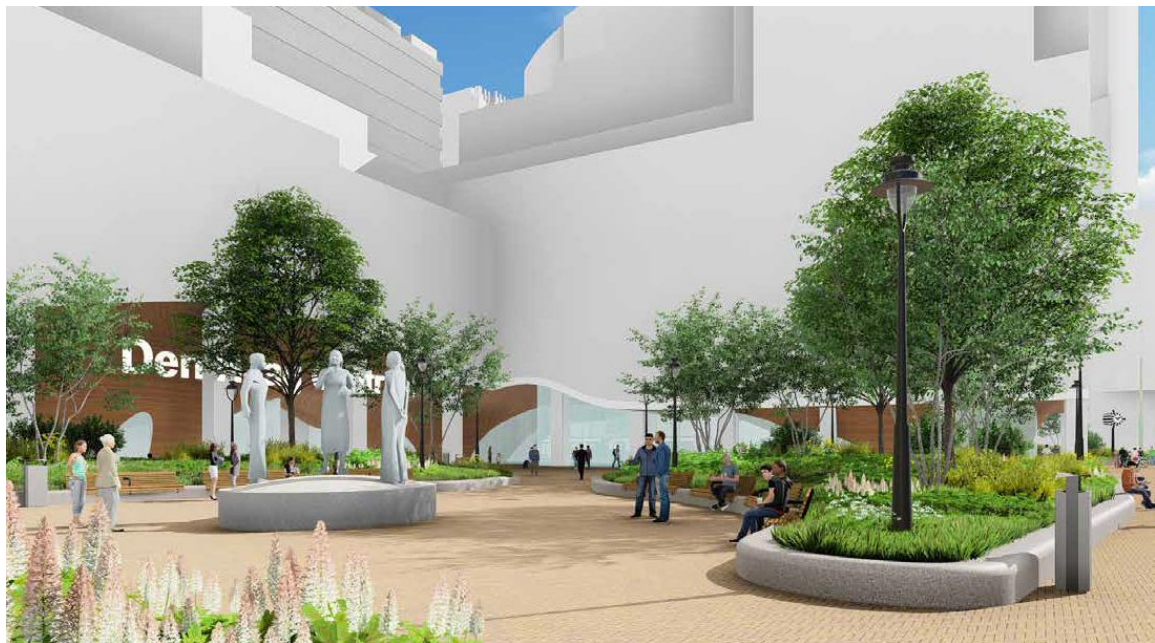
Figuur 3: het KJ monument is in het midden van het groene verblijfsgebied gepositioneerd.