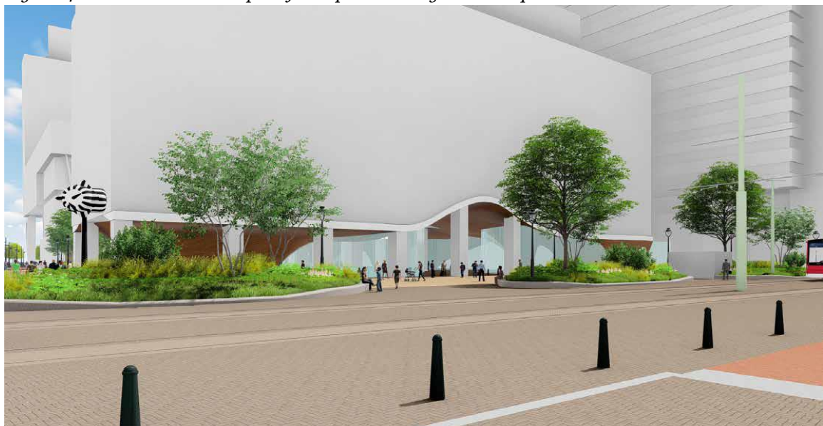
Figuur 5: situering van de teruggeplaatste zebraklok aan de Rijnstraat.