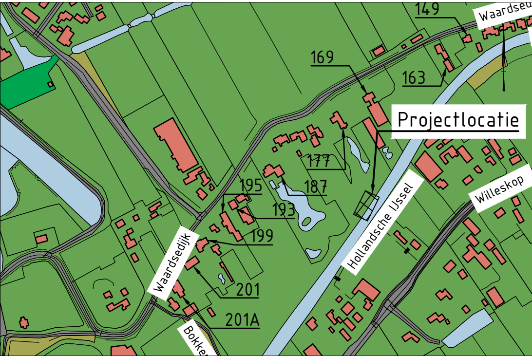
Situatie met projectlocatie, schaal 1:5000