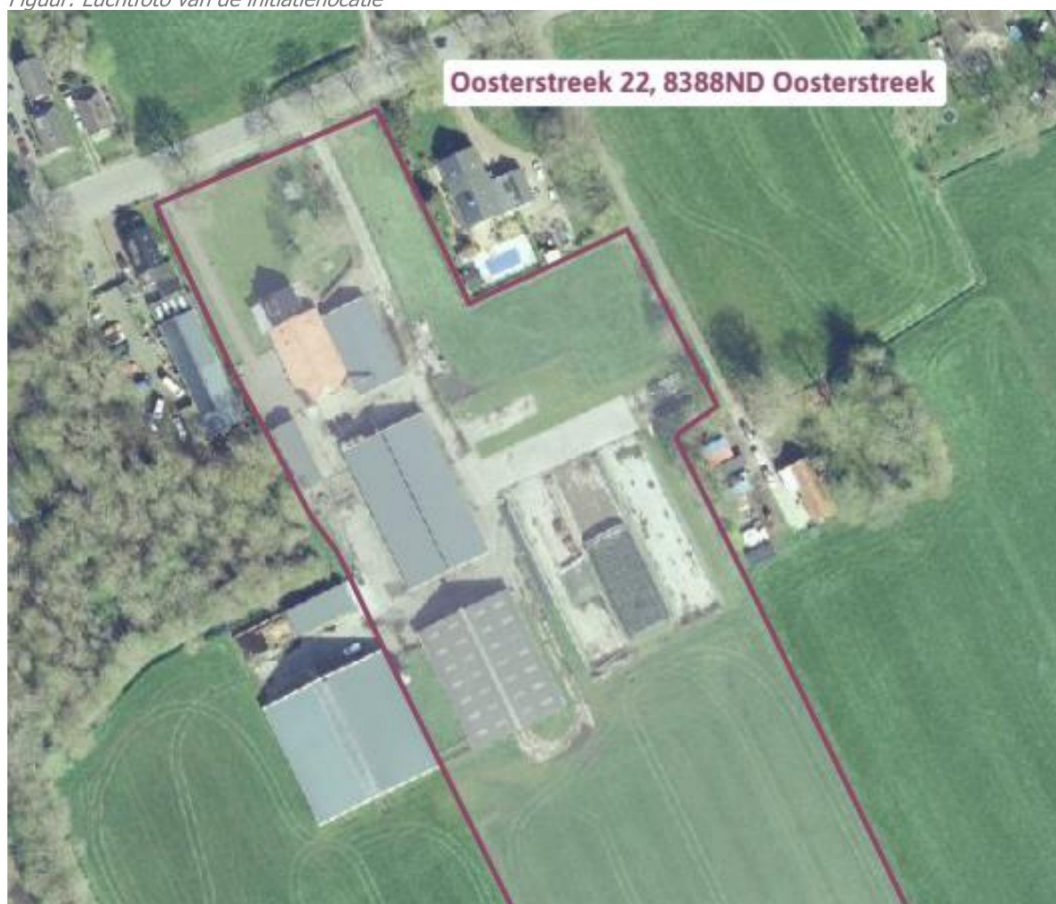
Figuur: Luchtfoto van de initiatieflocatie