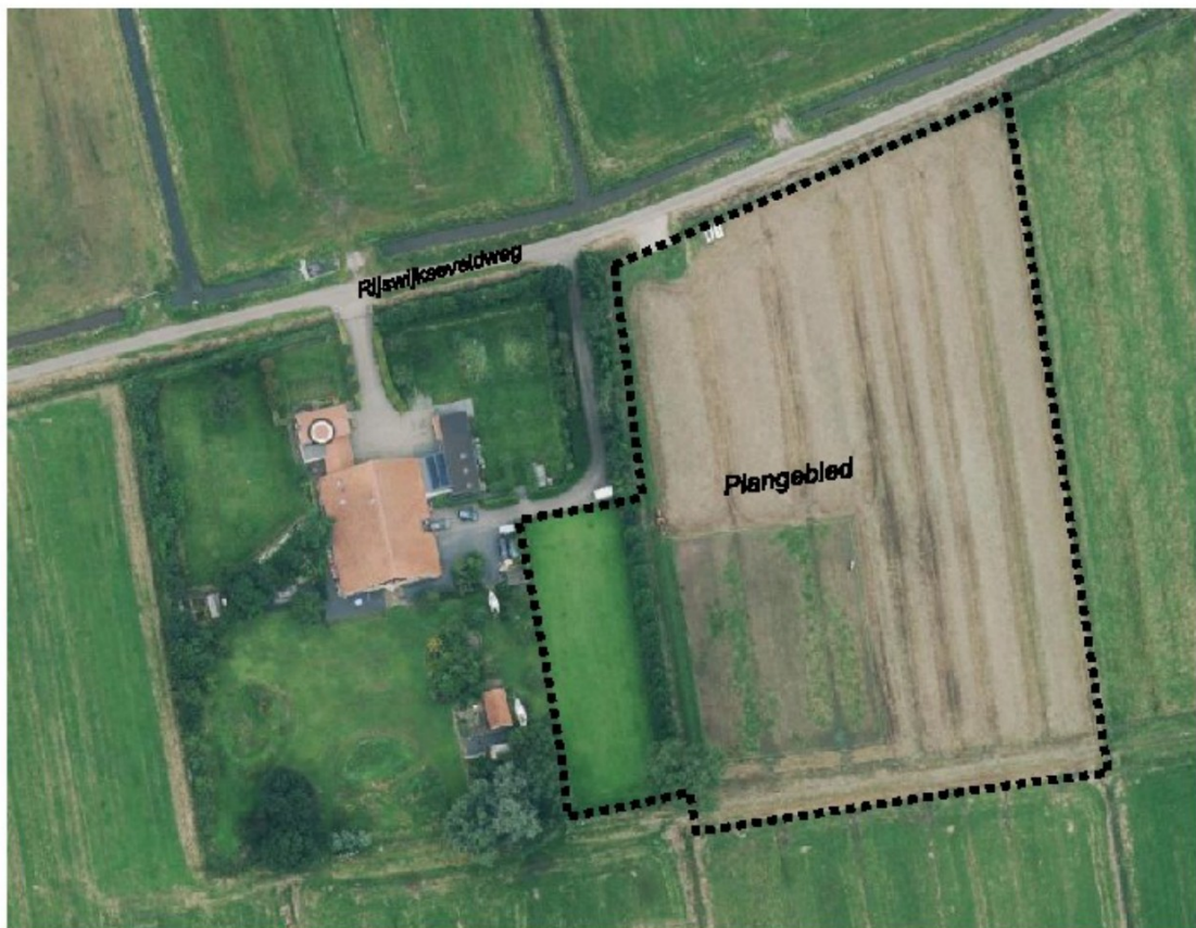
Figuur 1: Plangebied Rijswijkseveldweg (ong.), kadastraal bekend als gemeente Maurik, sectie M, nummers 966 en 1227.