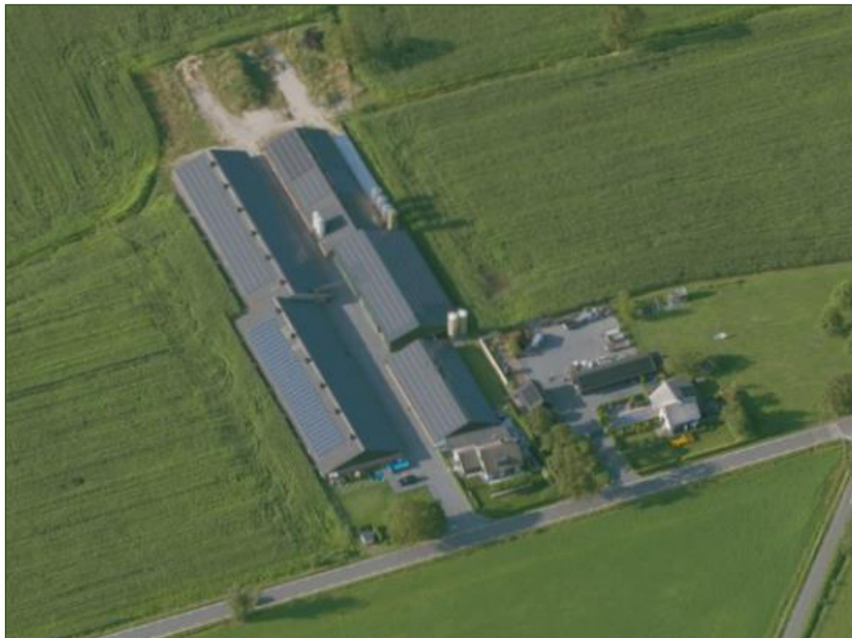
Figuur 1 Luchtfoto perceel Kapweg 33 te Kootwijkerbroek.

Een luchtfoto en topografische kaart met daarop de ligging van de locatie is in navolgende figuren weergegeven.