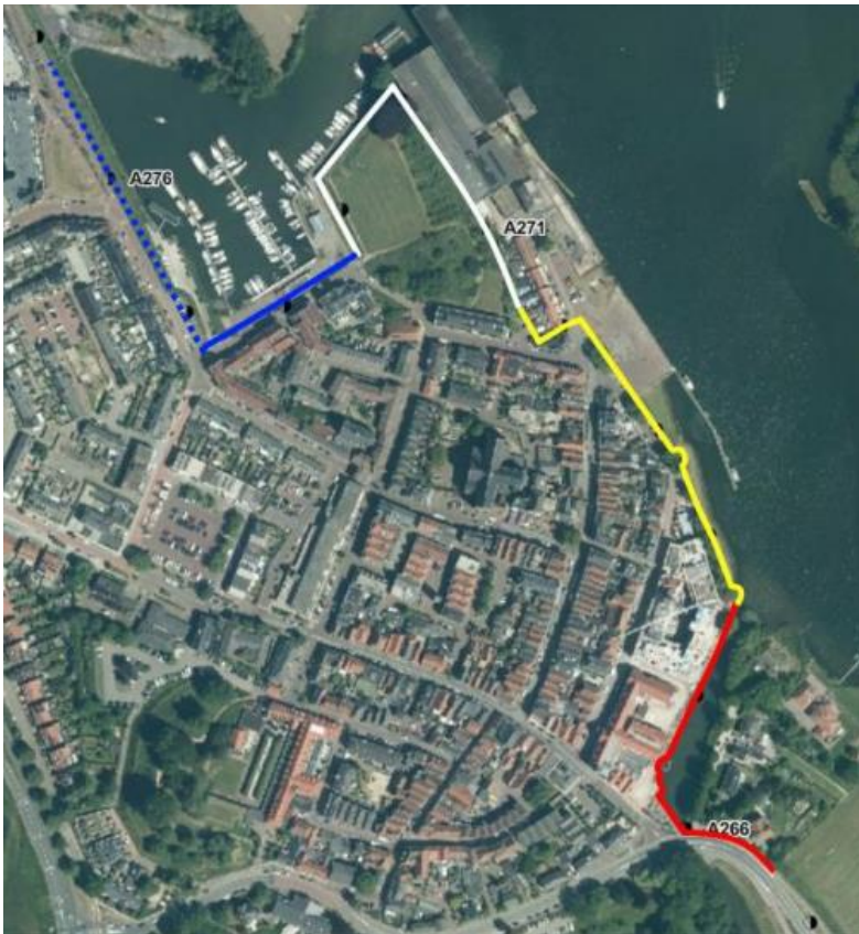
Figuur 2: Scope werkzaamheden kademuur Grave.