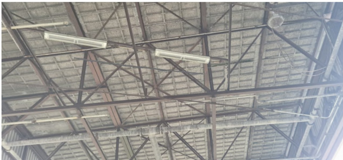
Duivenwerend net in dakoverkapping en ijzeren hekwerk tegen invliegen bij locatie Bargeloading