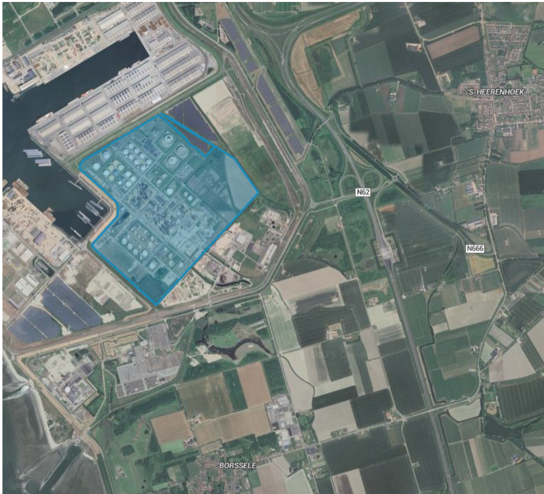
Figuur 1. Luchtfoto met daarop in blauw aangegeven het perceel met kadastraal nummer BSL01-A-1712, waar van de vergunning gebruik mag worden gemaakt.