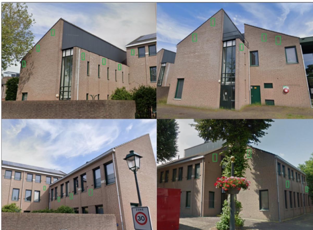
Figuur 3. Locaties van de permanente voorzieningen (groen vierkant).