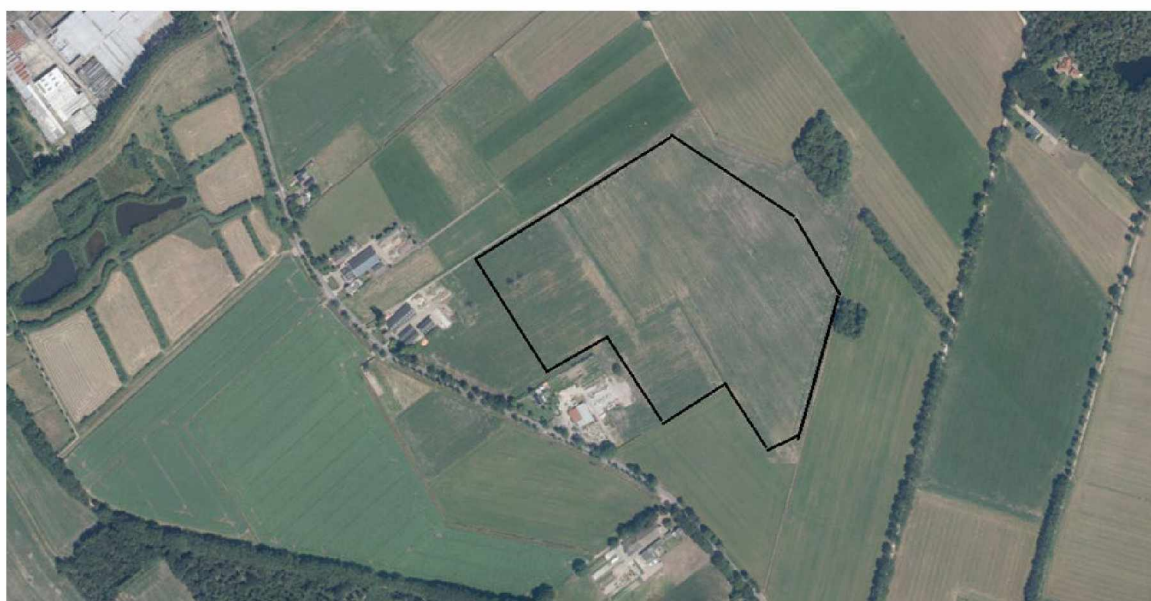
Figuur 1: Planlocatie Zonnepark Beeksedijk