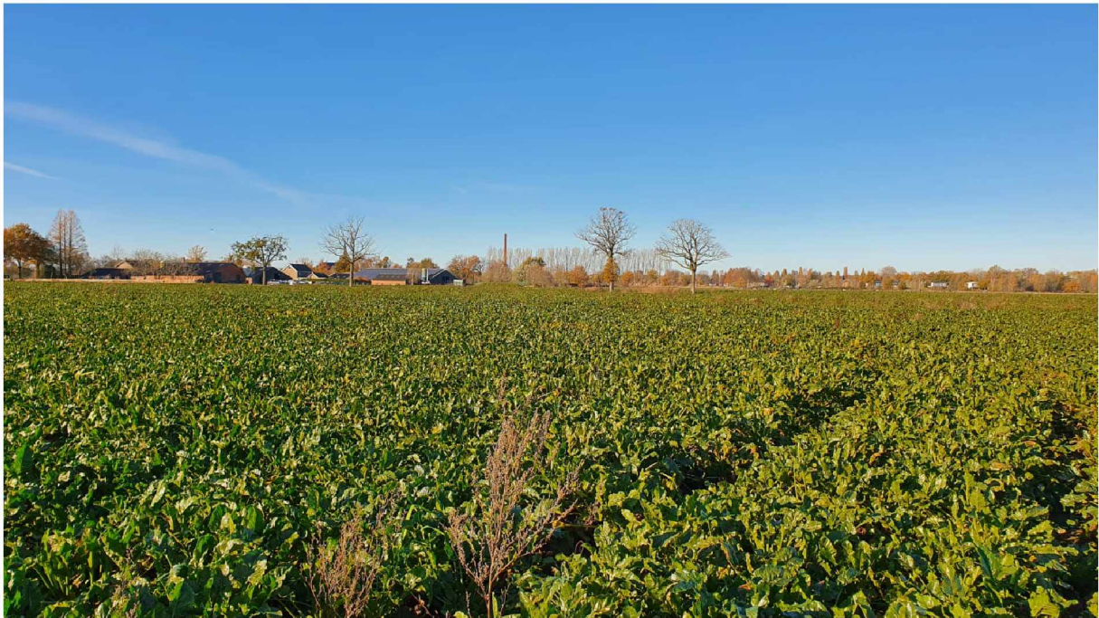
Foto 7: Westzijde plangebied, met zicht op de bestaande zomereiken binnen het plangebied.