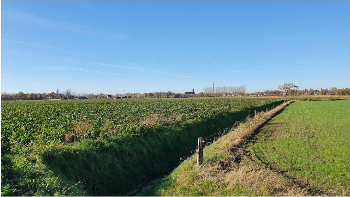
Foto 2: Noordoostzijde plangebied, grens(A-watergang) tussen plangebied(links) en buurperceel.