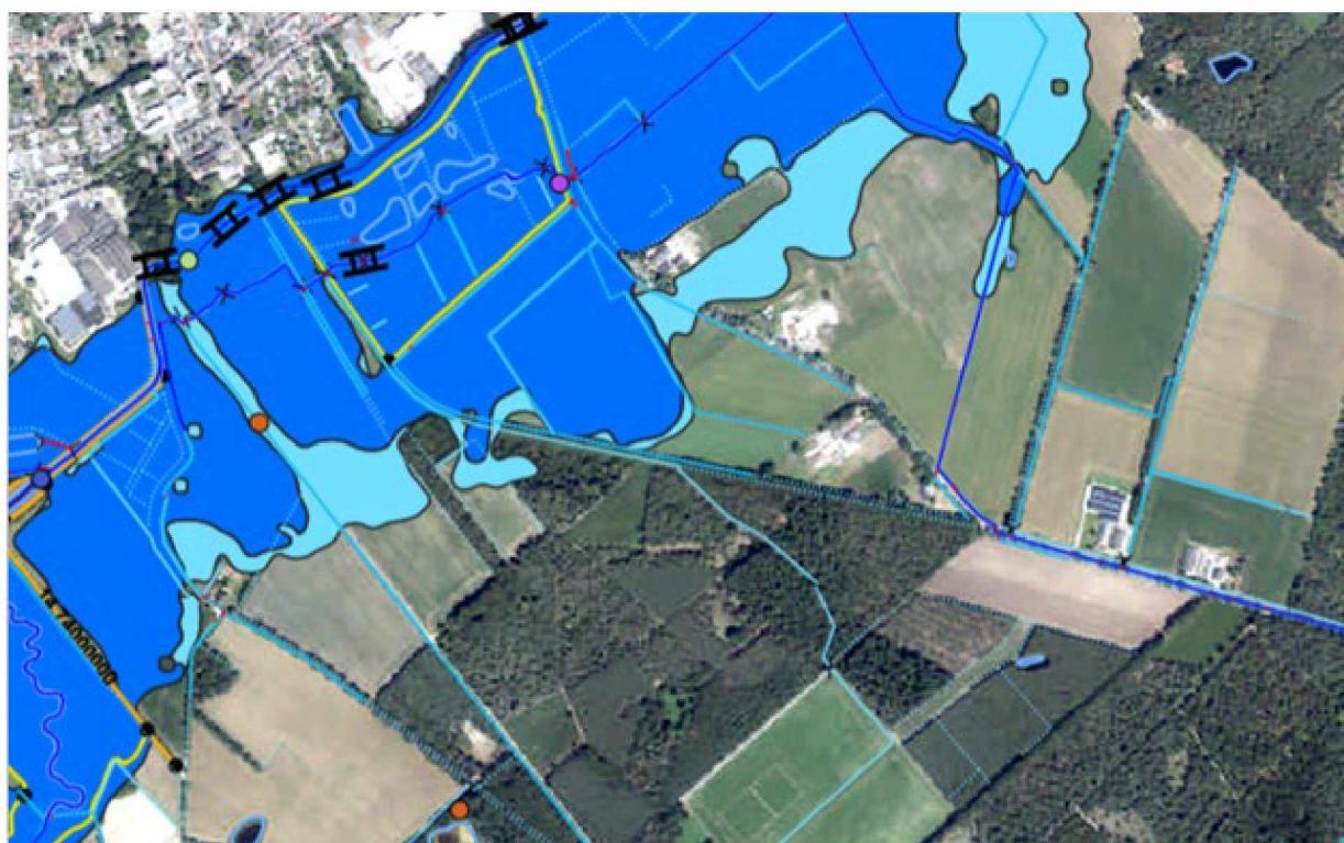
Figuur 5: Uitsnede legger waterschap de Dommel.

Binnen het plangebied zijn liggen geen waterkeringen. Wel bevindt het plangebied zich in een gebied aangewezen voor regionale waterberging (donkerblauw) en waterberging reserveringsgebied (lichtblauw). Zie onderstaande uitsnede uit de legger van Waterschap de Dommel.