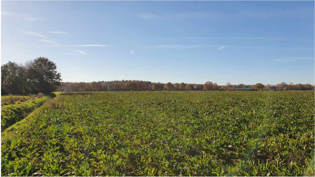
Foto 6: Zuidoostzijde plangebied, zicht op bosje met vennetje aan de linkerkant.