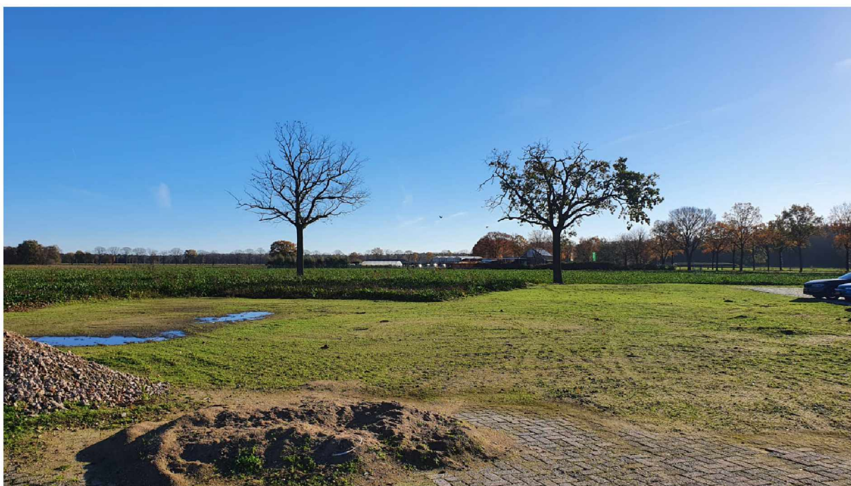
Foto 1: Noordwestzijde plangebied, genomen vanaf het kavel grondeigenaren. Zicht op westelijk deel van het plangebied.