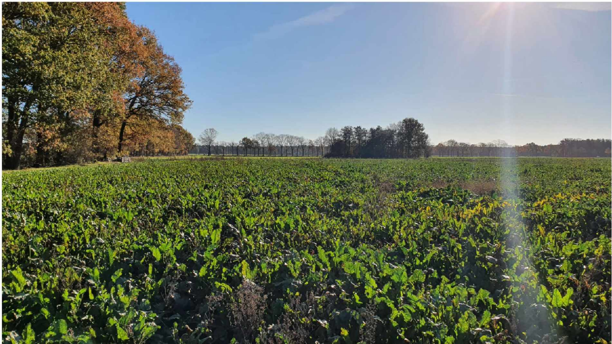
Foto 3: Noordoostzijde plangebied richting het zuiden. Zicht op de twee bosjes aan oostzijde en zuidzijde van het plangebied.