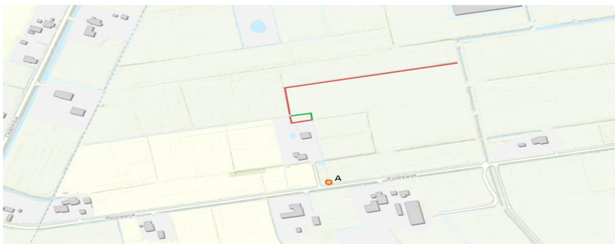
Figuur 2: De rode lijnen geven gedempte watergangen weer. De groene lijn geeft nieuw gegraven watergang weer. De oranje cirkel, locatie A, geeft de locatie weer, waar een dam met duiker aangelegd dient te worden.