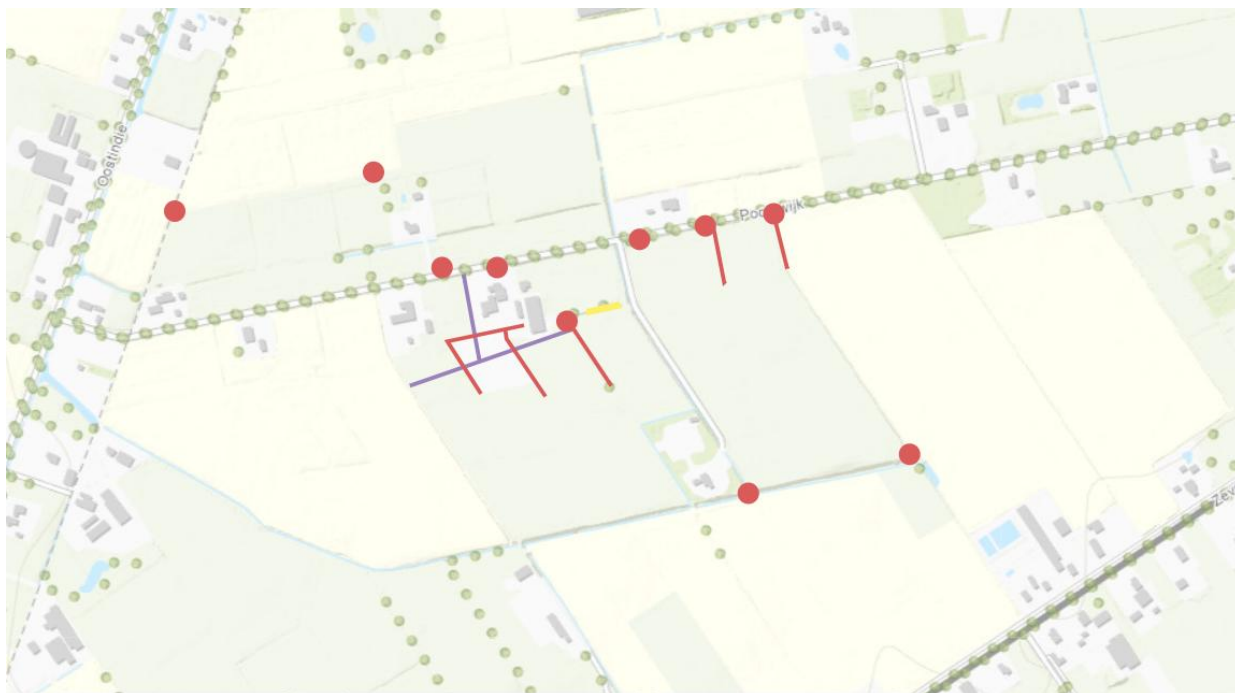
Figuur 3: De rode lijnen geven gedempte watergangen weer. De paarse lijnen geven nieuw gegraven watergangen weer. De rode stippen geven aangelegde duikers weer. De gele lijn geeft de verlengde duiker weer, welke voorzien dient te worden van een voorziening van waaruit de duiker kan worden doorgespoten.

De vergunningaanvraag is bij waterschap Noorderzijlvest geregistreerd onder het zaaknummer Z/25/080020. De aanvraag omvat de volgende voor dit besluit relevante stukken: