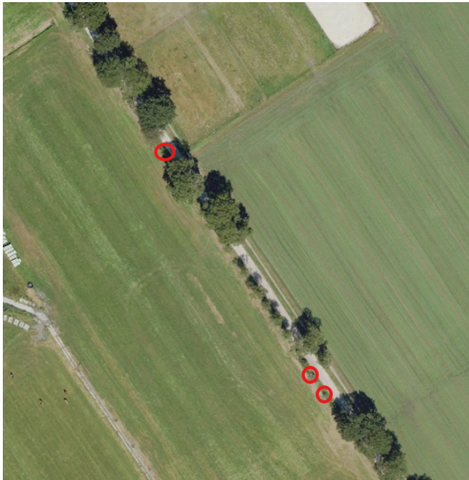
Afbeelding 2: herplantlocatie