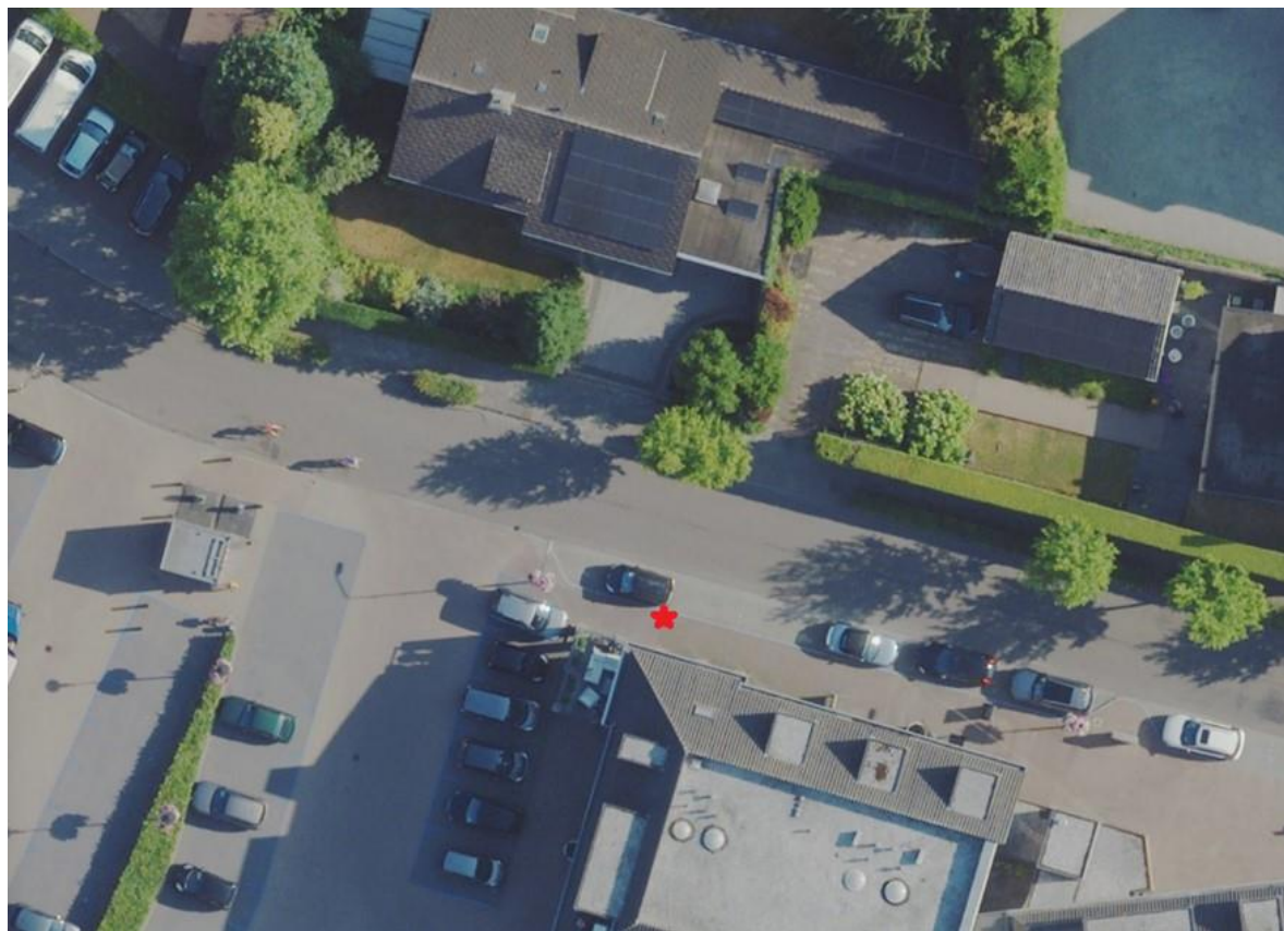
Zijaanzicht Margrietlaan 3A te Leende