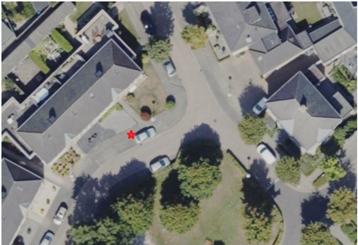
Zijaanzicht Kraanven 37 te Leende