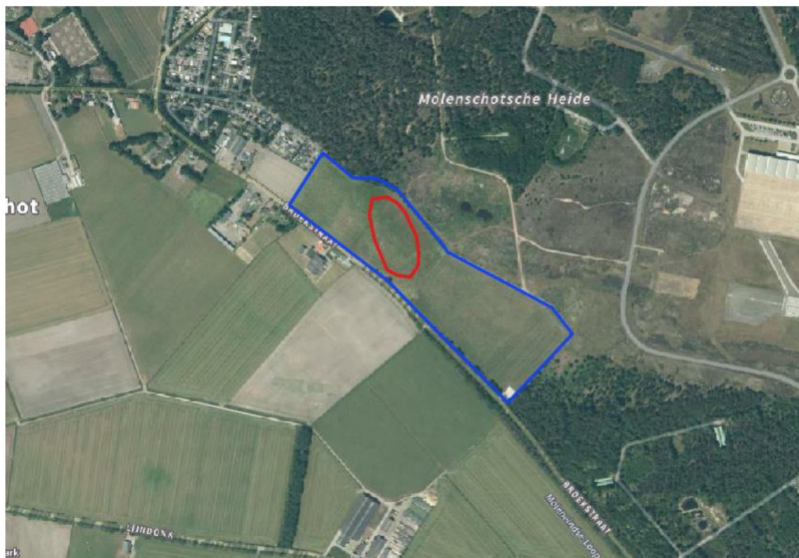
Afbeelding 1: begrenzing compensatiegebied/projectgebied (blauw), locatie van nieuwe poel/ontgraving (rood) en luchtfoto van huidige situatie terrein