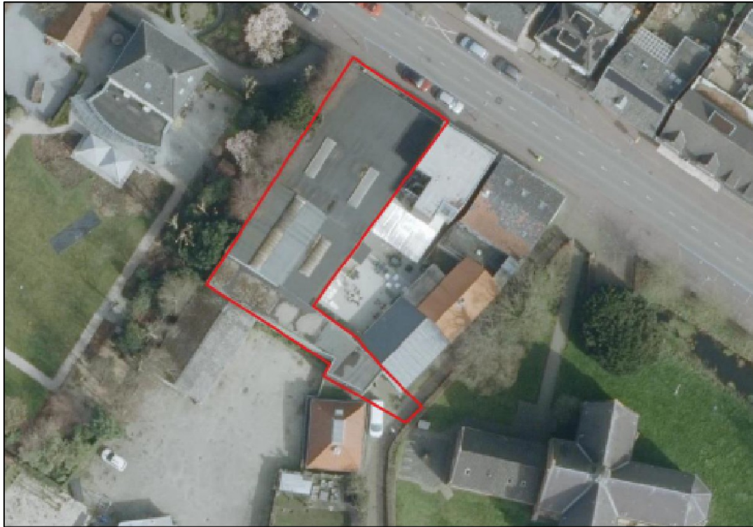
Figuur 1. Locatie Dorpsstraat 5a. De activiteiten vinden plaats binnen het omlijnde gebied.