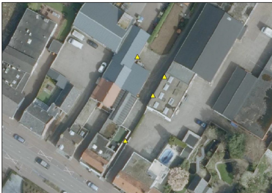
Figuur 2. Locatie van de tijdelijke voorzieningen ter hoogte van Dorpsstraat 32 en 34 te Chaam.