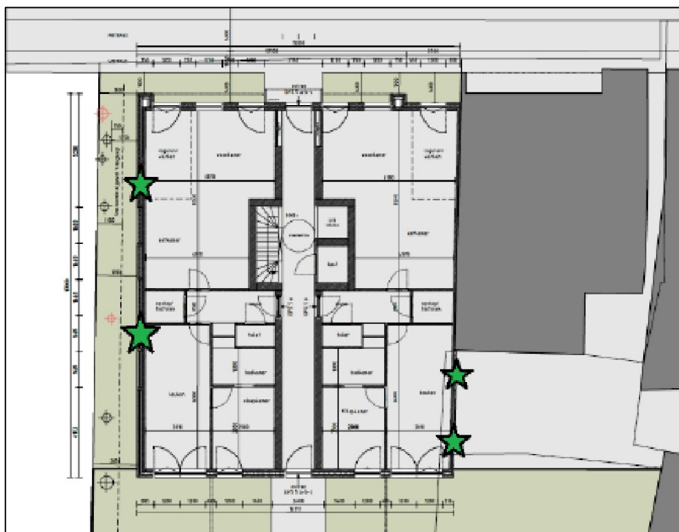
Figuur 3. Locatie van de permanente voorzieningen in de te realiseren nieuwbouw.