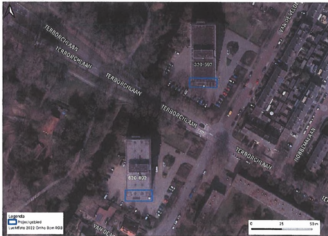
Figuur 1: plangebied weergegeven met blauwe kaderingen.