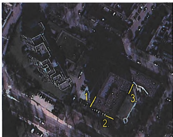
Afbeelding 7, locaties aangebrachte tijdelijke verblijfplaatsen.