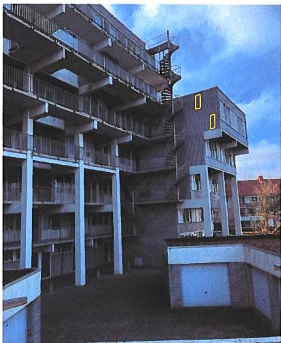
Afbeelding 11. Aan achterzijde appartementencomplex noordelijke hoek, kijkend in noordwestelijke richting