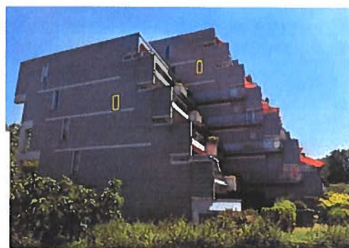
Afbeelding 14. Aan voorzijde appartementencomplex zuidelijke hoek, kijkend in zuidoostelijke richting