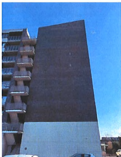
Afbeelding 9, 2-tal aangebrachte verblijven op locatie 2.