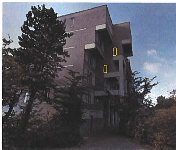
Afbeelding 12. Aan achterzijde appartementencomplex zuidelijke hoek, kijkend in noordwestelijke richting