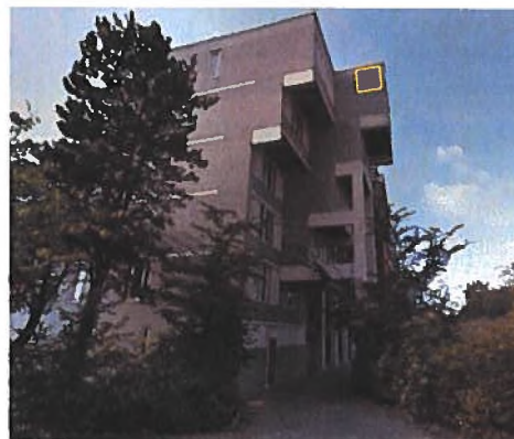
Afbeelding 16. Aan achterzijde appartementencomplex zuidelijke hoek, kijkend in noordwestelijke richting