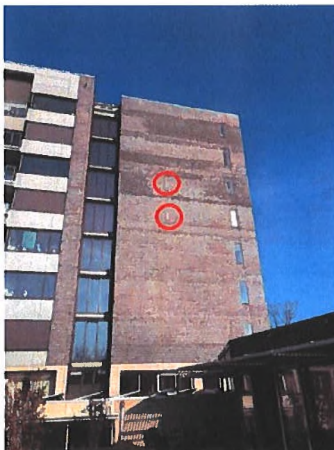
Afbeelding 10, 2-tal aangebrachte verblijven op locatie 3.