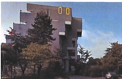
Afbeelding 13. In de zuidoostelijke kopgevel van het appartementencomplex (hoge naaldboom wordt geveld)