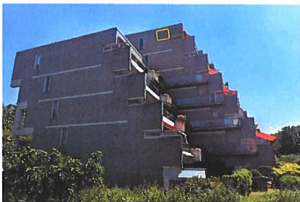
Afbeelding 18. Aan voorzijde appartementencomplex zuidelijke hoek, kijkend in zuidoostelijke richting