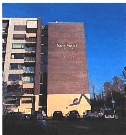
Afbeelding 8, 4-tal aangebrachte verblijven op locatie 1.