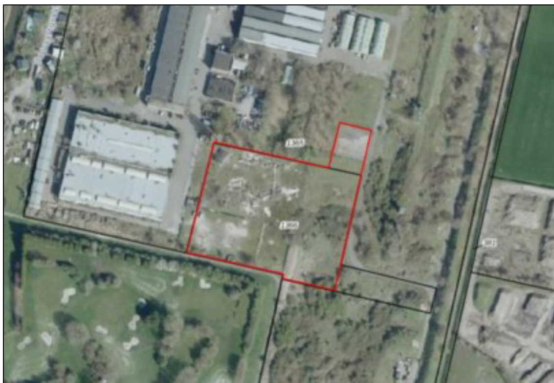
Figuur 1. Ligging plangebied. De activiteiten vinden plaats binnen het rood-omlijnde gebied.