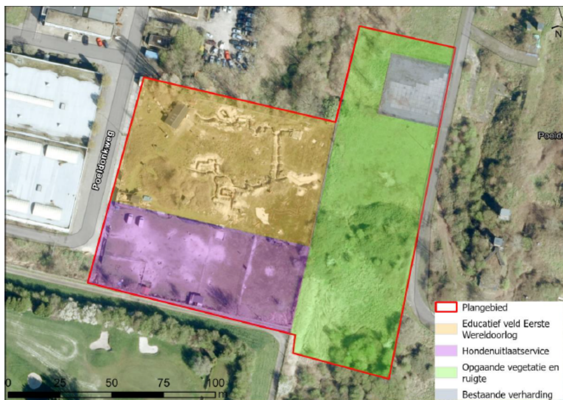
Figuur 2. Ligging van plangebied in detail, inclusief huidig gebruik.