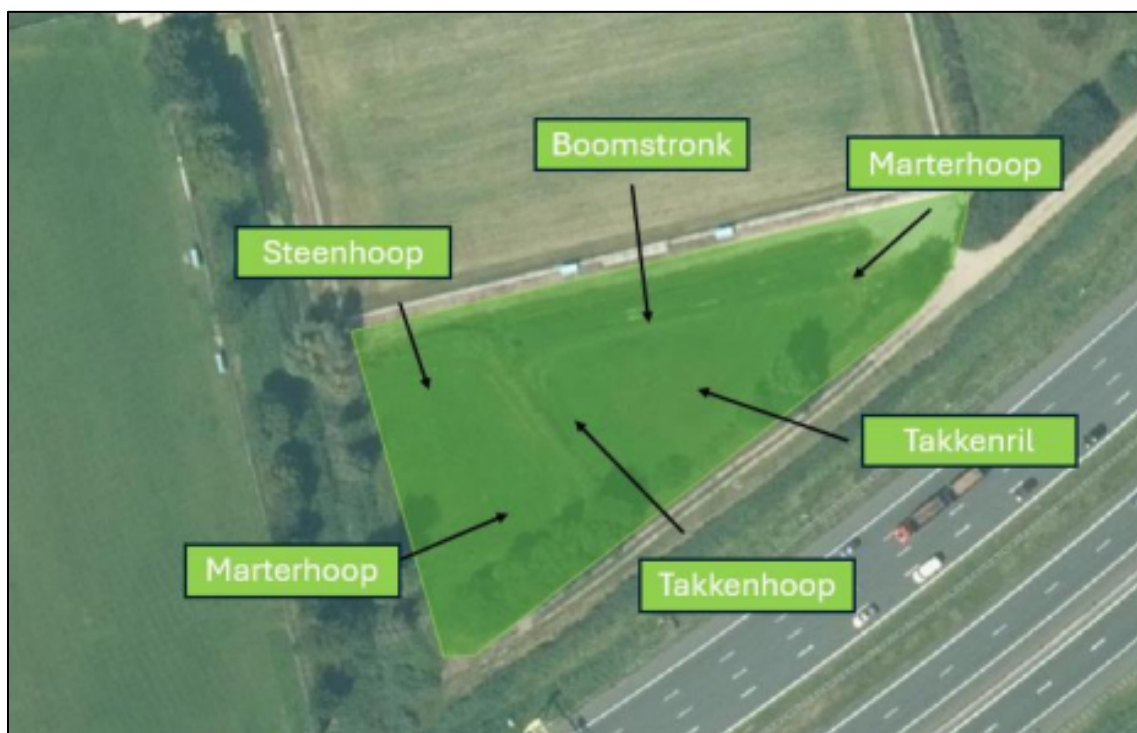
Figuur 4. Globale locatie van de te realiseren verblijfplaatsen