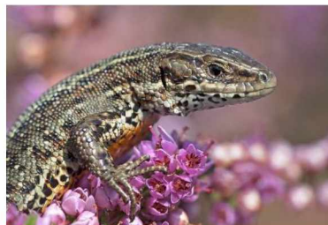
Levendbarende hagedis