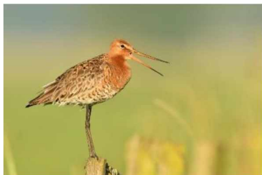
Doelsoorten: Grutto

Belangrijke doelsoorten voor het Riels Laag zijn de grutto, wulp en kievit. Mogelijk op termijn ook de korhoen. Ook op het vergroten van het leefgebied van reptielen wordt ingezet. Onder andere de hazelworm en levendbarende hagedis mogen verwacht worden.