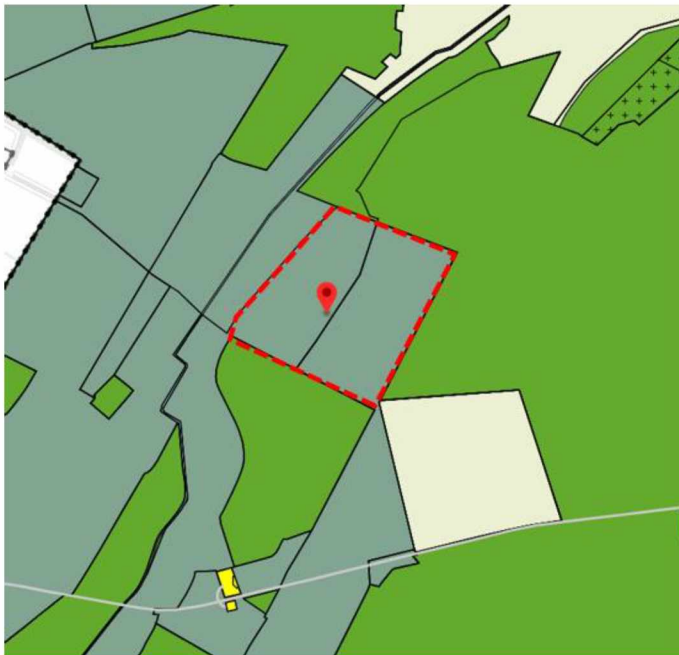
Uitsnede bestemmingsplan (perceel rood omlijnd)

Volgens paragraaf 6.5.1. is een aanlegvergunning nodig voor het verzetten van grond van meer dan 100 m 3 . Hierbij mag geen onevenredig afbreuk gedaan worden aan de archeologische en hydrologische waarde. Met de uitvoering van de maatregel is hiervan geen sprake.