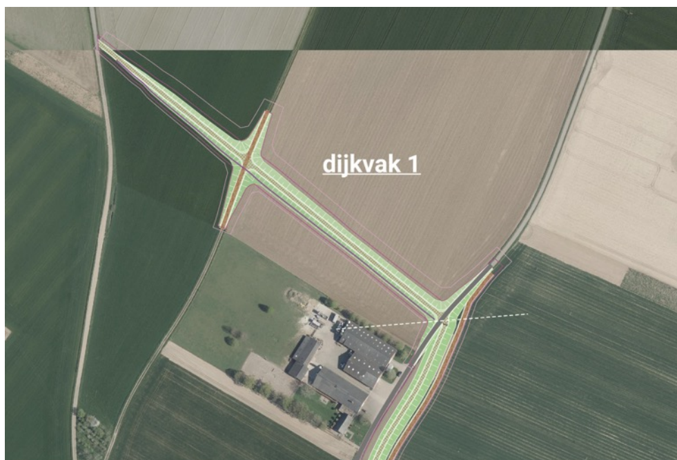
DO+ Buggenum: dijkvak 1

In dijkvak 1 maakt de dijk de aansluiting met de hoge grond. Ten einde het aantal dijkovergangen te minimaliseren is ervoor gekozen op de aansluiting daar te maken waar de Spirwitweg op kruinhoogte komt. De dijk start dus naast de Spirwitweg, waardoor hier geen dijkovergang nodig is en beheervoertuigen direct vanaf de Spirwitweg de dijkkruin op kunnen rijden. Richting het zuidoosten komt de dijk als het ware geleidelijk uit het maaiveld naar boven en koest deze in een rechte lijn af op de dijkovergang met de Arixweg. Hier wordt de knik in de dijk als het ware onder de bestaande verharde weg geschoven. Ook de Holpotterweg wordt gepasseerd met een lage dijkovergang.