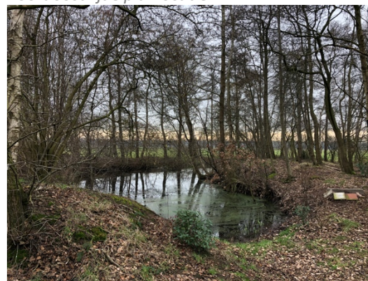
Ven in bosperceel, oostzijde