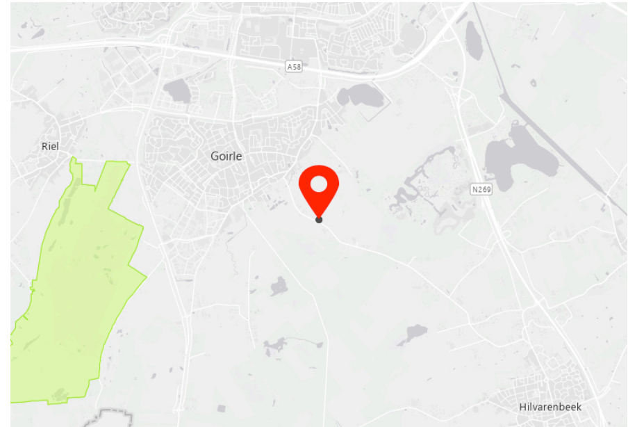
Afbeelding 3. Locatie plangebied (rood) N2000 (groen)