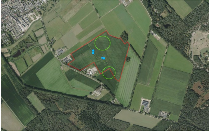
Figuur 5. Locatie plangebied (rood), wulp (blauw), Kievit (groen) (Pdok, z.d.)