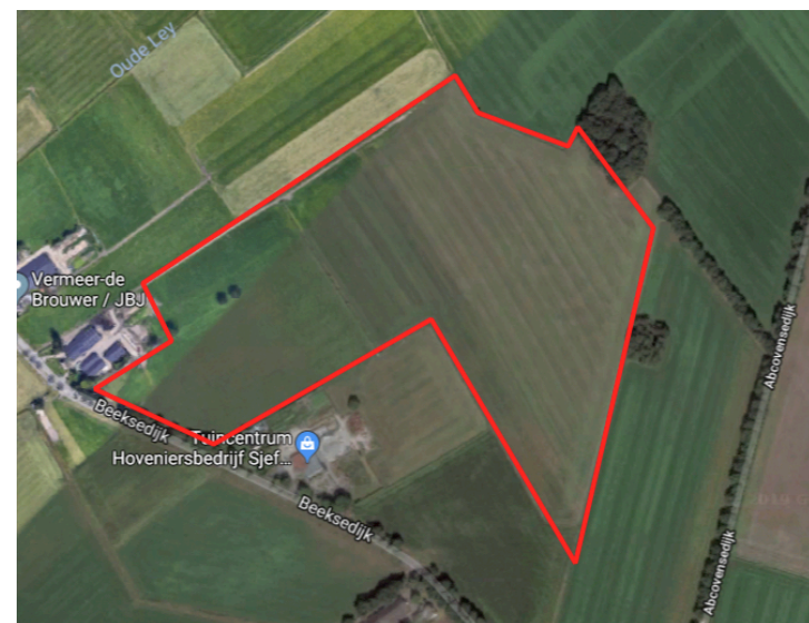
Afbeelding 1&2. Locatie plangebied (rood) (Google, z.d.)