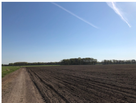
Verharding t.b.v. agrarische voertuigen, noordzijde