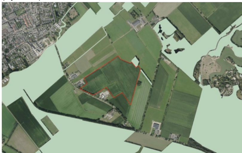
Figuur 4. Locatie plangebied (rood) NNB (groen) (BIJ 12, z.d.).

De locatie waar het onderzoek heeft plaatsgevonden grenst aan de NNB. Het beschermingsregime voor de NNB lijkt op dat voor N2000-gebieden. Activiteiten en projecten die de wezenlijke waarden en kenmerken kunnen aantasten zijn niet toegestaan. Er wordt een uitzondering gemaakt als er geen redelijk alternatief is, er een dwingende reden van openbaar belang is en compensatie plaatsvindt. De bescherming van de NNB is juridisch vastgelegd in het bestemmingsplan buitengebied van de gemeente. Als de geschetste realisatie overeenkomt met de bestemming dan zijn er geen beperkingen. Als voor de ontwikkeling een afwijking van het bestemmingsplan nodig is, dan is afstemming met de provincie nodig (BIJ 12, z.d.).