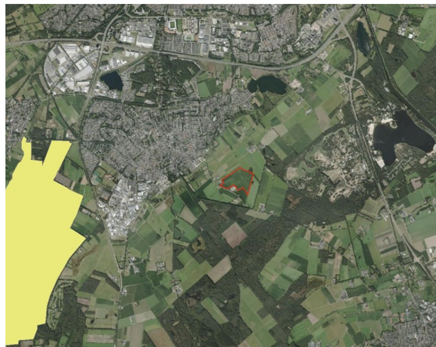
Figuur 3. Locatie plangebied (rood) N2000 (geel) (BIJ12, z.d.).