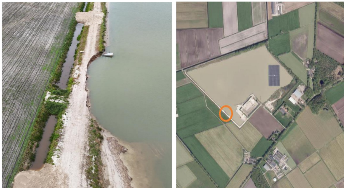
Luchtfoto's zandwinput Weperpolder, met links de bres. Op de rechterfoto is de locatie van deze bres omcirkeld.

Op 22 mei jongstleden is er voor het eerst in 2025 zand gewonnen uit de zandwinput Weperpolder. Deze zandwinning is door een fout van de zuigbaas echter op een verkeerde locatie uitgevoerd, waardoor er kleine bres is ontstaan in de zuidwesthoek van de put.