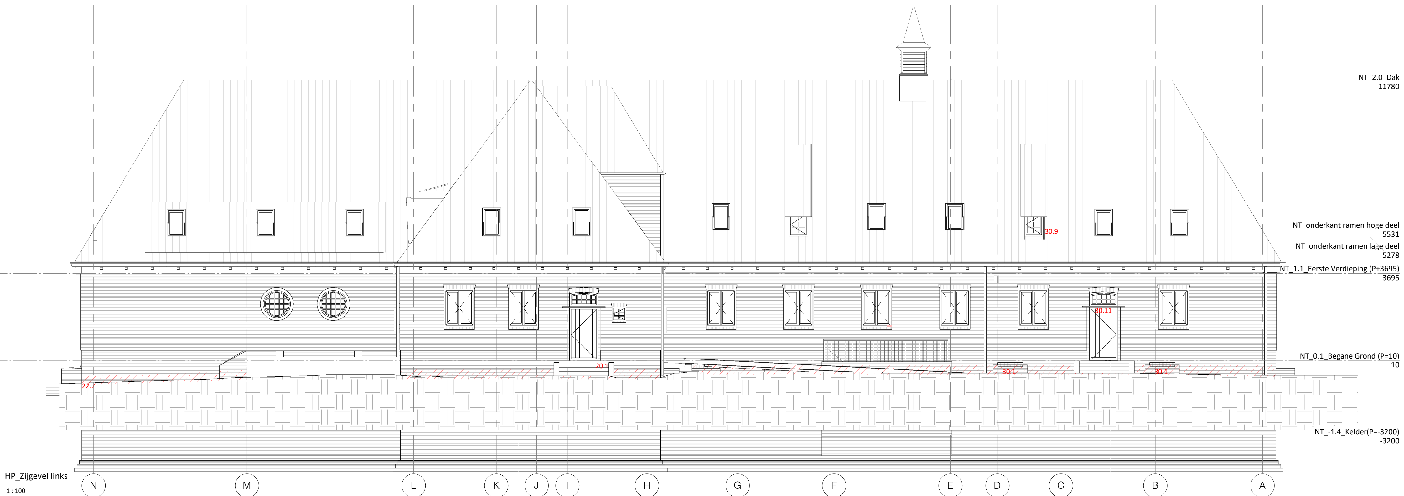
3 HP_Zijgevel links 1:100