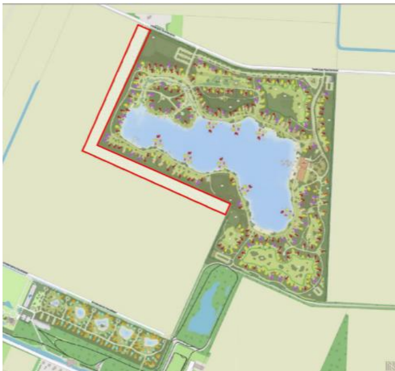
Figuur 3. Foerageergebied van de das