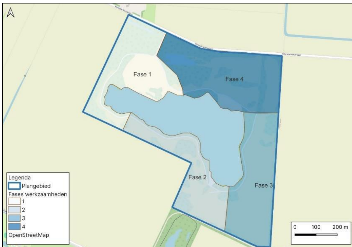
Figuur 2: fasering van uitvoering van de bouw- en aanlegactiviteiten binnen de 'noordkavel'

Voor details over (de periode van) uitvoering van de verschillende werkzaamheden en de fasering (in relatie met de kwetsbare periodes van de beschermde soorten) wordt verwezen naar paragraaf 2.3 en hoofdstuk 4 van het Activiteitenplan en paragraaf 3.3 van dit besluit.