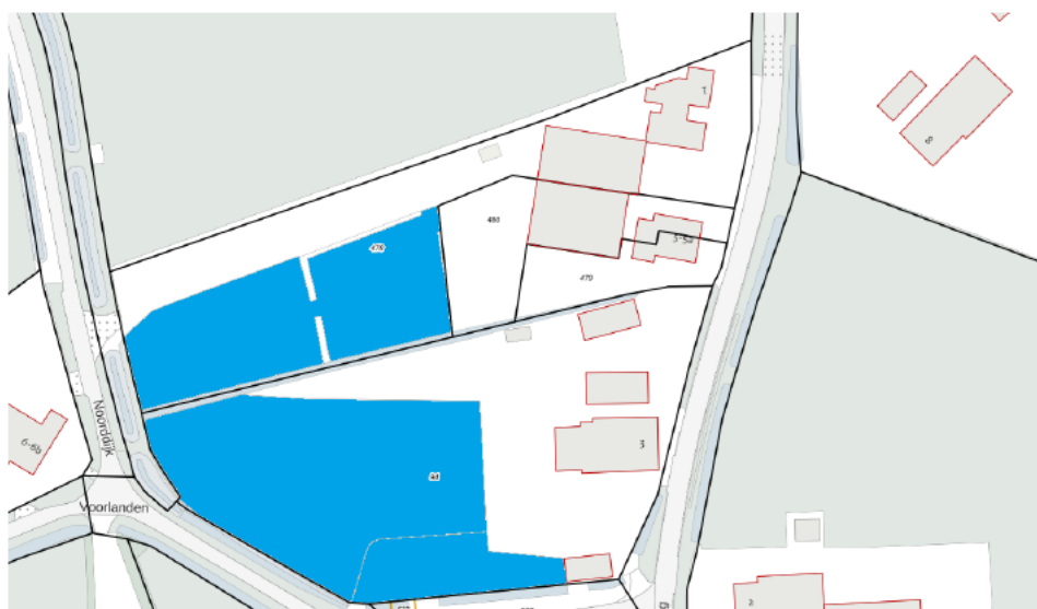
Weergegeven: percelen 94 en 478