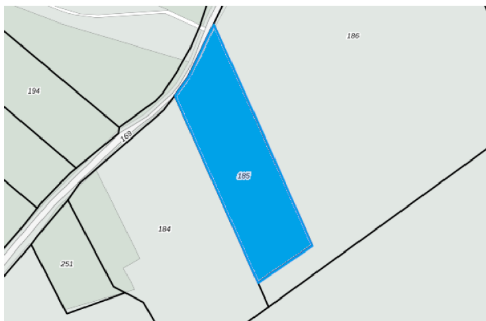
Weergegeven: percelen 185