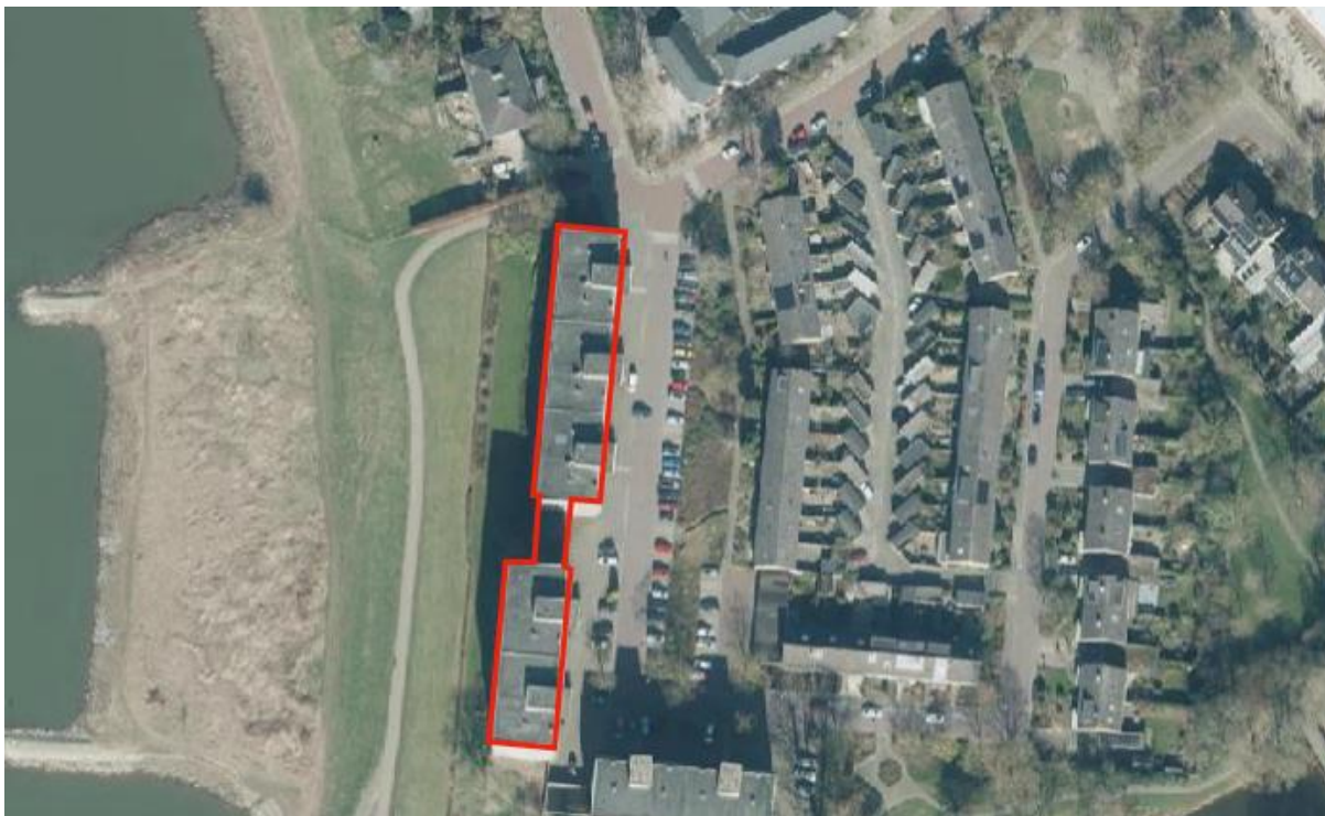
Figuur 1 – planlocatie en onderzoeksgebied

Zutphen is een stad in de Nederlandse provincie Gelderland, gelegen aan de rechteroever van de rivier de IJssel. Het is de hoofdplaats van de gemeente Zutphen met 48.545 inwoners en de stad heeft 39.705 inwoners.