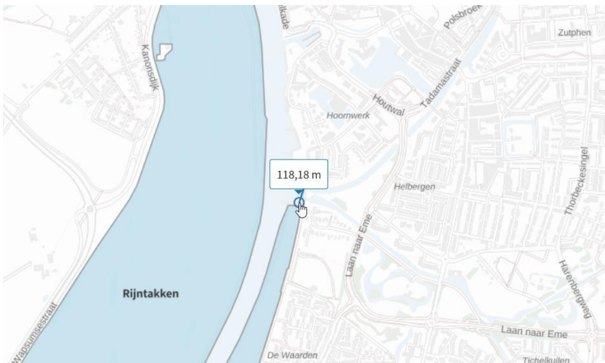
Figuur 2 – Natura 2000-gebied Rijntakken

Om te bepalen of dit het geval is moet een natuurtoets worden uitgevoerd door een deskundig bureau. Als uw activiteit een negatief effect heeft op de instandhoudingsdoelstellingen van het Natura 2000-gebied is een vergunning nodig, voor meer info zie: vergunning Natura 2000-gebieden.