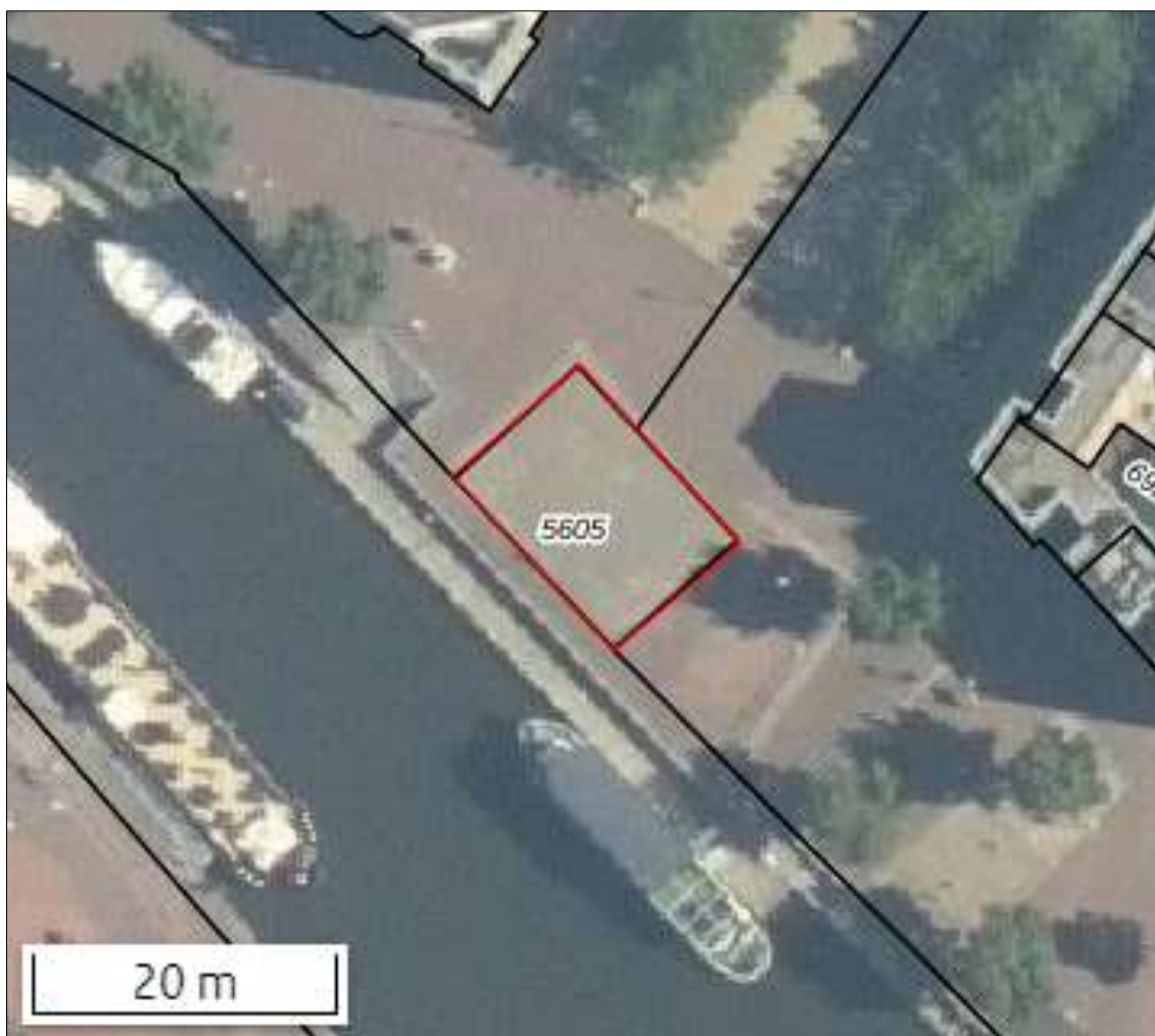
Figuur 1. Ligging van het projectgebied, aangegeven in rood. Bron kaartondergrond: ruimtelijkeplannen.nl