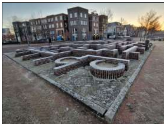
Foto's 1 en 2. Links het projectgebied gezien vanuit het oosten. Rechts het projectgebied gezien vanuit het westen.