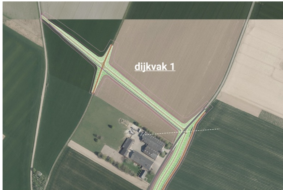
DO+ Buggenum: dijkvak 1

In dijkvak 1 maakt de dijk de aansluiting met de hoge grond. Ten einde het aantal dijkovergangen te minimaliseren is ervoor gekozen op de aansluiting daar te maken waar de Spirwitweg op kruinhoogte komt. De dijk start dus naast de Spirwitweg, waardoor hier geen dijkovergang nodig is en beheervoertuigen direct vanaf de Spirwitweg de dijkkruin op kunnen rijden. Richting het zuidoosten komt de dijk als het ware geleidelijk uit het maaiveld naar boven en koest deze in een rechte lijn af op de dijkovergang met de Arixweg. Hier wordt de knik in de dijk als het ware onder de bestaande verharde weg geschoven. Ook de Holpotterweg wordt gepasseerd met een lage dijkovergang.