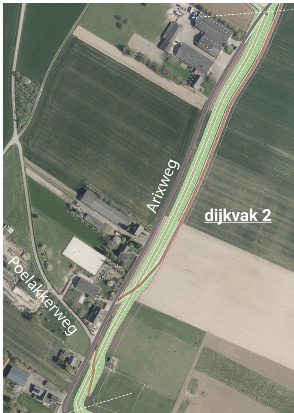
DO+ Buggenum: dijkvak 2

Dijkvak 2 volgt de oostzijde van de Arixweg tot aan de kruising met de Groeneweg. De lage dijk wordt zo dicht mogelijk tegen de weg gepositioneerd. Oostelijk van de dijk is een kavelpad voorzien, waarmee de buitendijks gelegen percelen vanaf de dijkovergang met de Arixweg worden ontsloten. Aanvullend is in het verlengde van de Poelakkerweg een lage dijkovergang voorzien, aangevuld met een daaraan gespiegelde dijkovergang voor kavels van een andere terreineigenaar. Onderaan deze dijkovergangen en op de dijkovergang met de Arixweg worden hekken geplaatst om het wandelen op de kruin van dit dicht langs woonbebouwing lopende dijkvak te ontmoedigen.