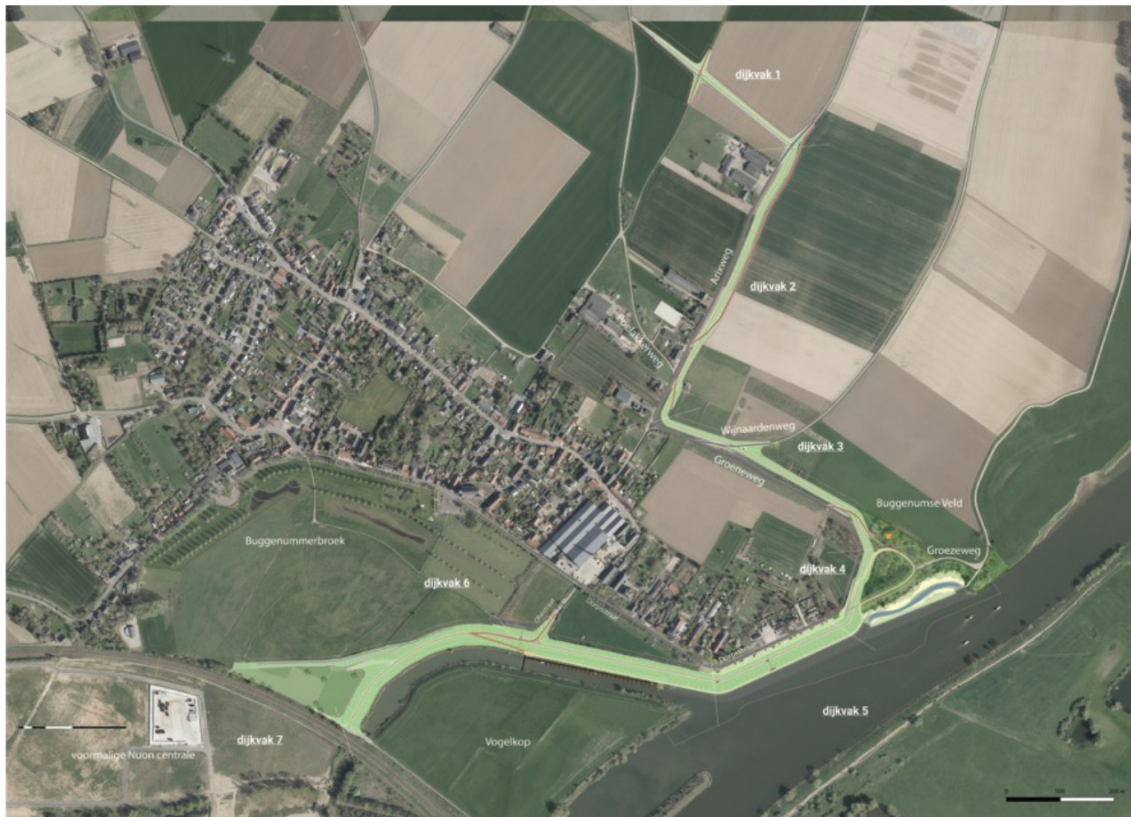
Overzichtstekening DO+ dijkversterking Buggenum

Ook is zowel vanuit de opgave om een uniform dijkprofiel met een groene kruin te realiseren als vanuit wensen van aanwonenden gekozen voor het beperken van fiets-, wandel- en landbouwverkeer op en over de dijk. Het wandelen op de dijk is gezoned, waardoor de delen waar de dijk dicht langs de woonbebouwing liggen zoveel mogelijk worden ontzien. Hiertoe zijn niet alleen (deels in leuningen langs dijkovergangen geïntegreerde) hekken voorzien, maar is vooral het wandelen onderaan de dijk (zowel binnen- als buitendijks) zo aantrekkelijk mogelijk gemaakt. Het DO+ wordt hieronder per dijkvak nader toegelicht.