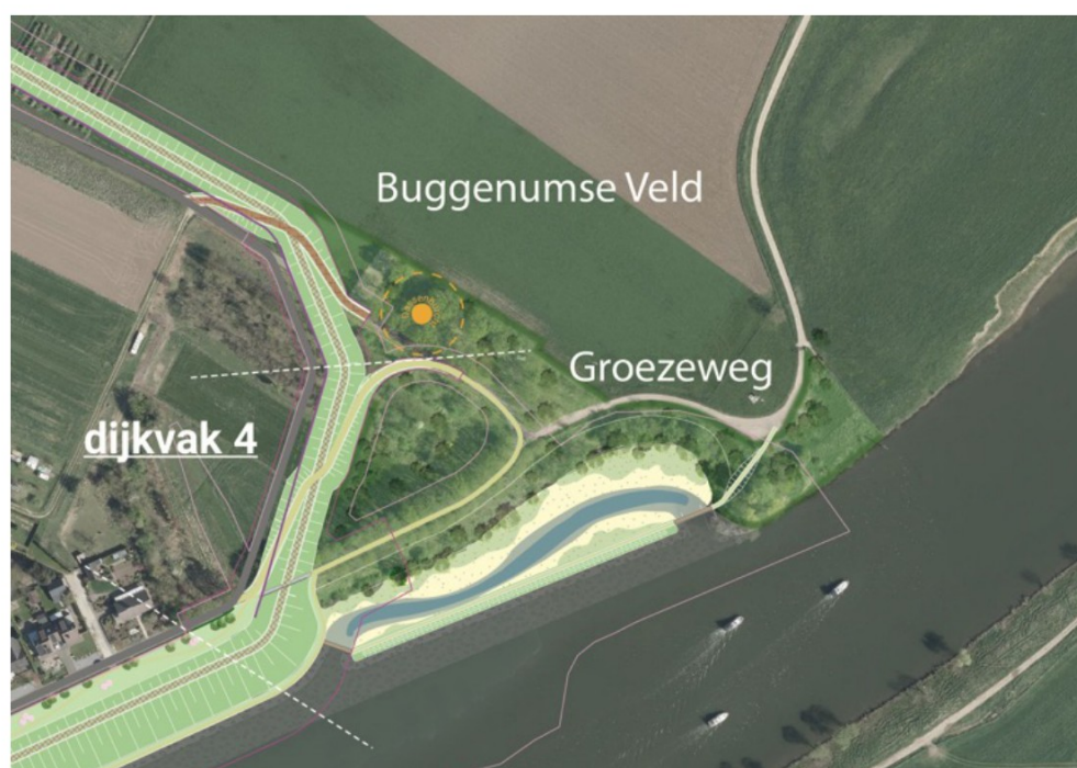
DO+ Buggenum: dijkvak 4

Vanaf het knikpunt tussen dijkvakken 3 en 4 begint de dijk zich sterker boven het maaiveld te verheffen. De dijk doorkruist hier een aantal agrarische percelen. Het dijktracé is zo gekozen dat er voor deze binnendijks een zo goed mogelijk bruikbaar stuk land overblijft om het gebruik als boomkwekerij voort te zetten en dat de dijk buiten de verstoringscontour van de buitendijks gelegen bewoonde kunstburcht voor dassen komt te liggen. Het deel van deze percelen dat buitendijks komt te liggen zal mogelijk een meer extensief agrarische of natuurlijk karakter krijgen, hetgeen zou leiden tot een logische positie van de dijk als scheidlijn tussen natuur en landbouw.