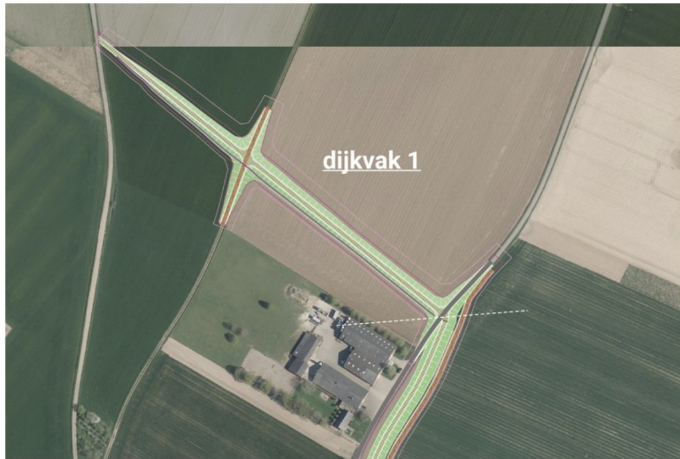
DO+ Buggenum: dijkvak 1

In dijkvak 1 maakt de dijk de aansluiting met de hoge grond. Ten einde het aantal dijkovergangen te minimaliseren is ervoor gekozen op de aansluiting daar te maken waar de Spirwitweg op kruinhoogte komt. De dijk start dus naast de Spirwitweg, waardoor hier geen dijkovergang nodig is en beheervoertuigen direct vanaf de Spirwitweg de dijkkruin op kunnen rijden. Richting het zuidoosten komt de dijk als het ware geleidelijk uit het maaiveld naar boven en koest deze in een rechte lijn af op de dijkovergang met de Arixweg. Hier wordt de knik in de dijk als het ware onder de bestaande verharde weg geschoven. Ook de Holpotterweg wordt gepasseerd met een lage dijkovergang.