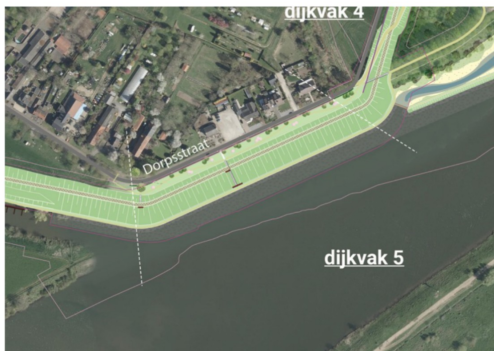
DO+ Buggenum: dijkvak 5

Langs de Dorpsstraat wordt de dijk feitelijk in het koelwaterkanaal gelegd, waarbij de huidige langsdam wordt verwijderd. Binnendijs ontstaat hierdoor tussen de Dorpsstraat en de teen van de dijk een brede strook die onder een flauwe helling vanaf de Dorpsstraat oploopt naar de teen van de dijk. Hierdoor komt de dijk niet alleen verder van de Dorpsstraat en de daar tegenover liggende huizen te liggen, maar lijkt de dijk door het geringere hoogteverschil tussen teen en kruin ook lager. Als afscheiding tussen de Dorpsstraat en deze groenstrook is een heg voorzien. De groenstrook zelf wordt ingezaaid met gras en er worden enkele lage bomen (maximaal 5 meter hoogte) geplaatst.