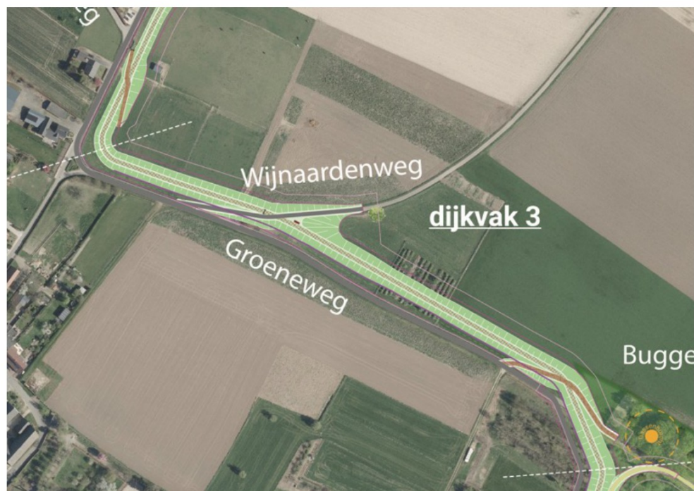
DO+ Buggenum: dijkvak 3

Bij de kruising van de Arixweg en de Groeneweg maakt de dijk een knik naar het oosten en volgt deze de noordzijde van de Groeneweg. De dijk wordt hier langzaam iets hoger, met name daar waar deze twee oude geulrelicten kruist. Net als bij de Arixweg wordt bij de dijkovergang van de naar het noorden afbuigende Wijnaardenweg het dijklichaam onder het tracé van de verharde weg geschoven. Om de realisatie van de dijk en de dijkovergang op deze plek mogelijk te maken zal een karakteristieke boom gerooid moeten worden. Deze wordt in de nabijheid van de dijkovergang gecompenseerd. Op de dijkovergang is een zitelement voorzien, dat uitzicht biedt op het Buggenumse veld.