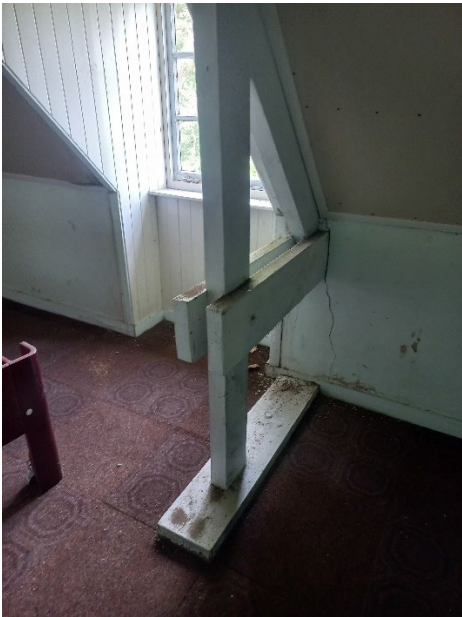
Verticale scheur in gevel bij