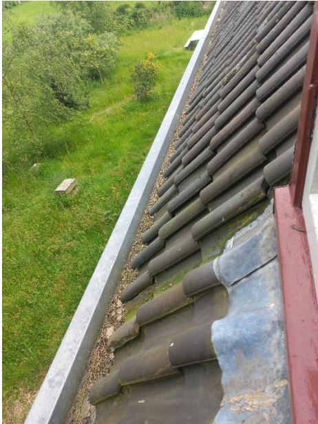
Goot zit er nieuw uit