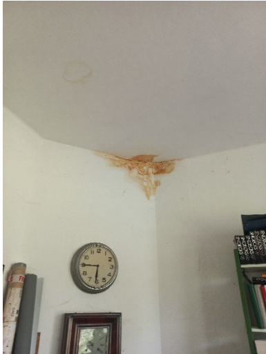
40.4 Vlekken , lekkage in de hoek van de schoorsteen. Vuil meegetrokken uit de schoorsteen