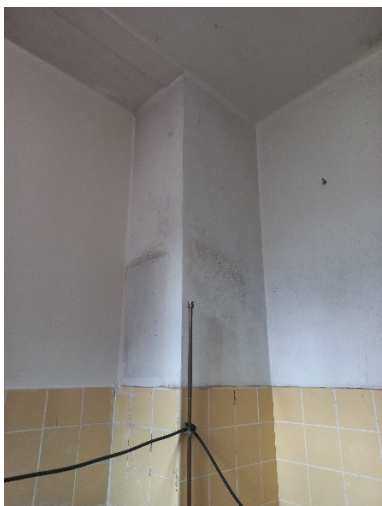
40.6 Beschimmelde wand van de schoorsteen