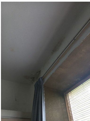
40.5 Stucwerk los in de hoek