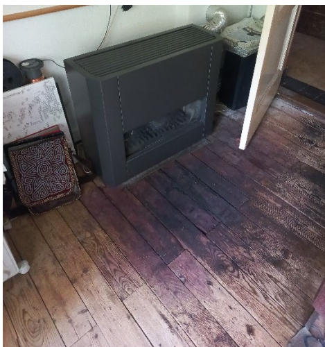
Houten vloer beschadigd door de hitte/as van het vuur