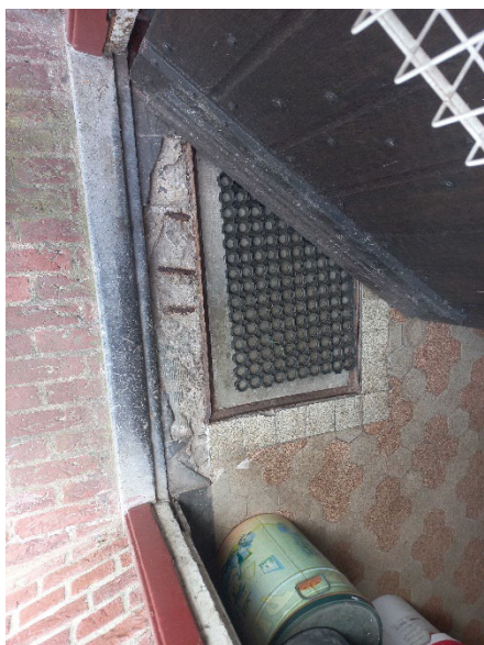
41.3 Tegelrand bij deurentree is kapot