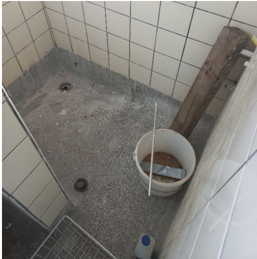
41.4 Terrazzo vloer in de badkamer