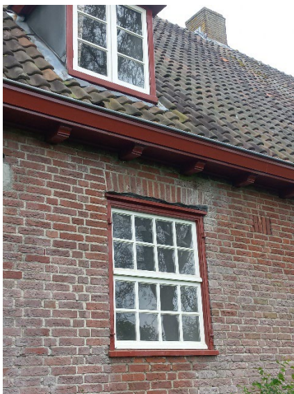
30.6 Lood is niet terug gezet na het schilderen van de kozijnen