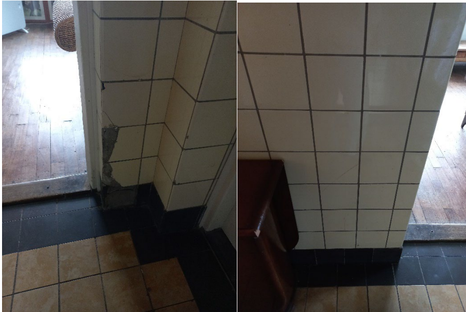
41.2 Scheur in tegelwerk op de muur, Drie tegels zijn gebroken