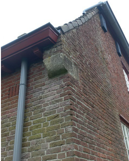
Natuursteen element is versleten, hoeft niks mee te gebeuren