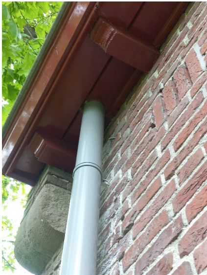
22.5 Overtollig ijzerwerk in de gevel