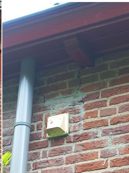
Verticale en horizontale scheur in metselwerk