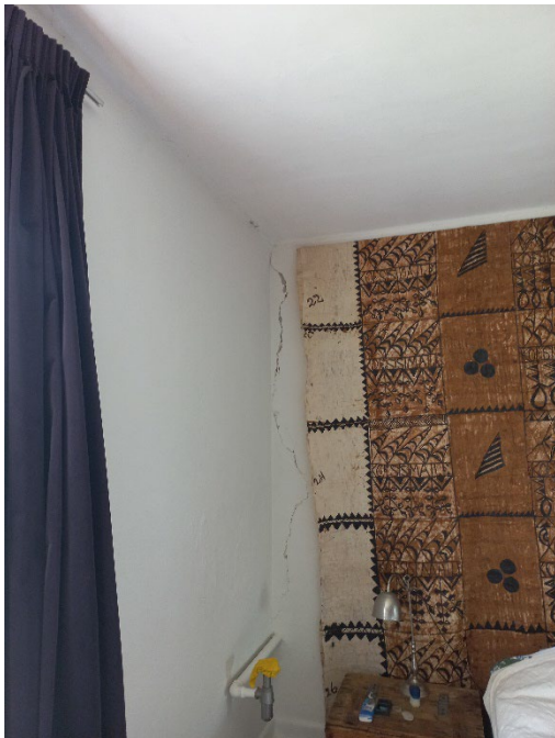
22.13 Verticale scheur in muur, van boven tot beneden